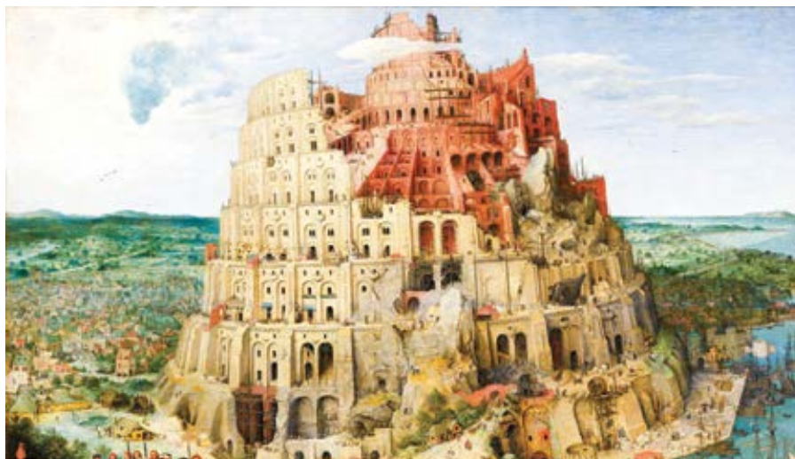
Pieter Bruegel starší: Babylonská věž (1563)

způsoby, jak se to může stát. Můžeme se rozzlobit na druhé, když vidíme, jak hřeší a nedosahují duchovní dokonalosti. Sv. Jan říká, že takoví lidé se „povyšují na pány ctností“ a jednájí v příkrém rozporu s ctností mírnosti.