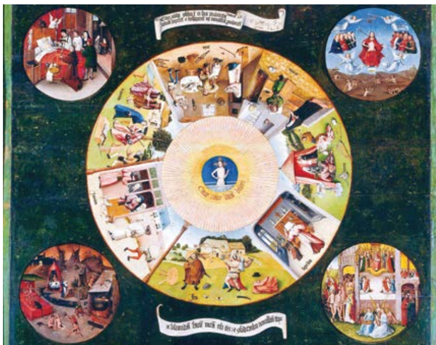
Hieronymus Bosch: Sedm smrtelných hříchů (1505–1510)

O morální dokonalost sice musíme usilovat, ale čistě jen proto, abychom se líbili Bohu. Naše touha po dokonalosti