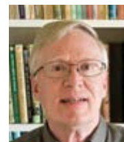
Jeff Mirus Catholic Culture Přeložila Alena Švecová

Jde jen a jen o to, co chceme. A tím, co chceme, je velmi často to, o čem nám Molek říká, že to máme chtít. Obnáší to ovšem háček a důsledek. Je to stejně staré jako lidstvo samo a znovu a znovu se to v každém z nás opakuje nebo se o to usilovně snaží. Tvrdíme, že o žádných takových procesech nevíme, ale když se schováváme před sebeuvědoměním, schováváme se před Bohem.