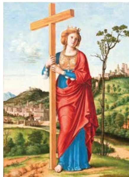
Giovanni Battista Cima da Conegliano: Svatá Helena (1495)

Dědictví těchto raných katolických poutí v evropské společnosti přetrvávalo a je dodnes cítit v křesťanské komuni-