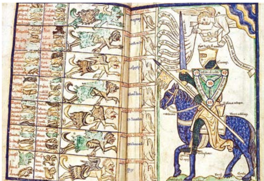
anonym: alegorická postava rytíře se chystá na boj se sedmero hlavními hříchy s pomocí „Scutum Fidei“ jako štítem (cca 1255–1265)