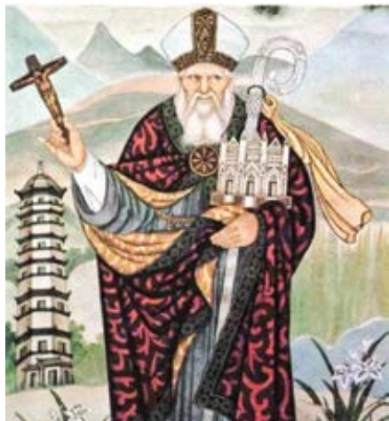
Jan z Montekorvina, italský františkánský misionář, pekingský arcibiskup a zakladatel nejstarší římskokatolické misie v Číně a Indii (13. st.).

tože ten nikdy nebyl celý zveřejněn. Je pravda, že k svěcení biskupů teď dochází s papežským pověřením, ale to se prakticky dělo už před uzavřením dohody, a tak nejde o ústupek Komunistické strany Číny. Ve skutečnosti bylo při svěcení biskupů Vlasteneckého sdružení, před i po uzavření dohody, dovoleno veřejně přečíst pouze jmenovací dekret od Vlasteneckého sdružení, zatímco papežská jmenovací bula mohla být přečtena pouze soukromě předem v sakristii.