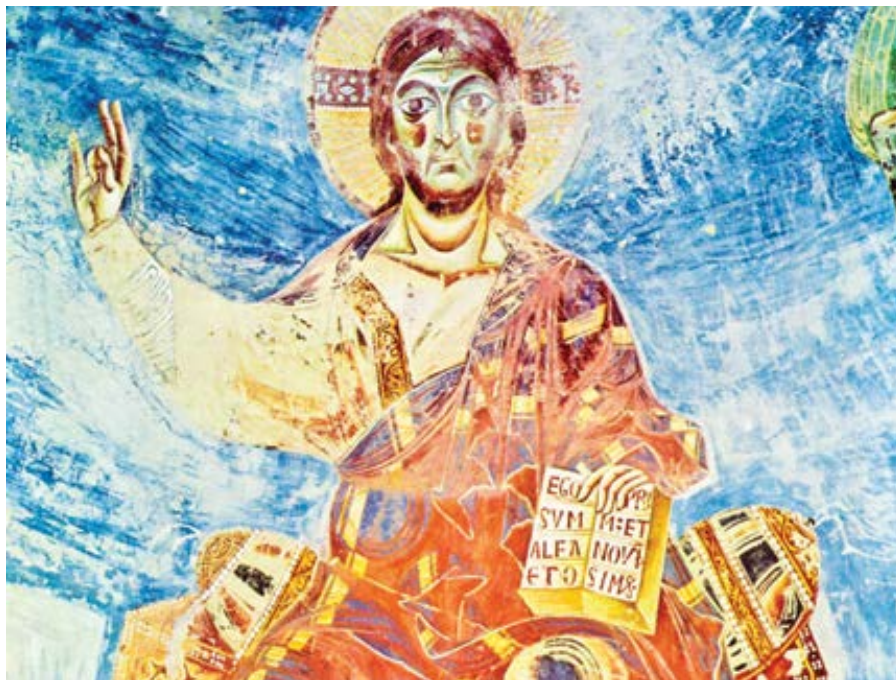
Italský byzantský mistr: Kristus Pantokrator (cca 1100)

Podívejme se však, aby se snad tento výrok nevztahoval na všechny hříchy. Neboť co když se někdo dopustí některého z hříchů, které jsou smrtelné (např. se stane cizoložníkem, vrahem...), je rozumné v takových věcech napomínat mezi čtyřma očima, a když poslechne, hned o něm říci, že byl získán? Nebo má být nejprve vyloučen z církve, nebo až poté,