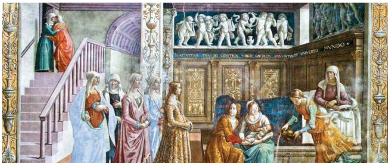
Domenico Ghirlandaio: Narození Panny Marie (1485)