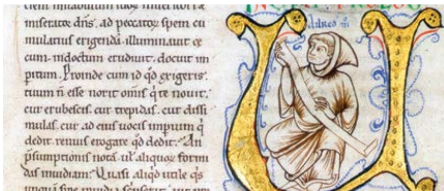
Sv. Aelred z Rievaulx.

Dositheus ztrácel trpělivost a mluvil s pacienty hrubě. Plný výčitek svědomí pak utíkal do své cely, padl na podlahu, hořce plakal a prosil Boha o milost. Jeho upřímná lítost umožnila, aby v něm působila Boží milost, a s Boží pomocí se Dositheus nakonec stal tak laskavým, trpělivým a veselým, že nemocní toužili po jeho přítomnosti.