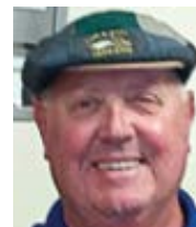
Dennis Dillon Catholic Stand Přeložila Pavel Štíčka

V závěru mše svaté kněz často říká: „Oslavujte Boha svými skutky.“ Vzájemná láska má být na našem seznamu skutků na jednom z nejpřednějších míst.