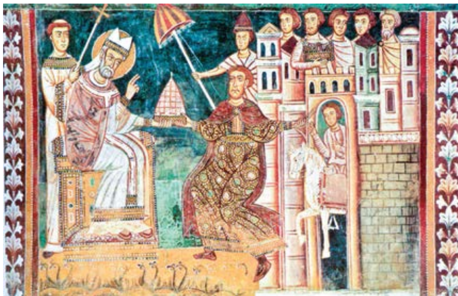
Kaple sv. Silvestra v Santi Quattro Coronati, Řím.

Sv. Silvestr byl následujícího roku zvolen papežem – pro církev to byla doba velkých změn a příslibů. Nový papež se jednak musel zorientovat ve zcela nové, bezprecedentní situaci; ale musel také trpělivě jednat s Konstantinem, který byl jednou z nejdominantnějších osobností tehdejší doby (i dob následujících). Císař byl přesvědčen, že mu Bůh svěřil odpovědnost nejen za politickou správu, ale i za vedení a ovlivňování církve. Konstantin se jako velký, přátelský pes, který nezná svou sílu a je zvyklý, že