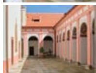
poutní areál Římovo po rekonstrukci