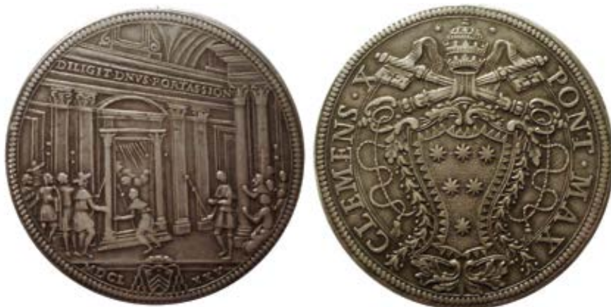
Piastr ze Svatého roku 1675 vydaný za Klementa X. římskou mincovnou.

obrazném stylu: „Zároveň však liturgii ohrožovaly klimatické podmínky a také mnohé restaurátorské zákroky a hrozilo, že bude zničena, pokud se rychle neudělá to nejnnutnější, aby se těmto škodlivým vlivům zamezilo.“ Dokonce je třeba vše učinit pro to, „aby se znovuodkrytí nestalo prvním krokem k definitivní ztrátě“. Toto nelibé pokračování už však v našem prvoplánově pochvalném dokumentu schází. Skutečnému poznání koncilu a jeho následného působení nikterak nenapomůžeme, budeme-li se uchylovat k zamlčování a polopravdám.