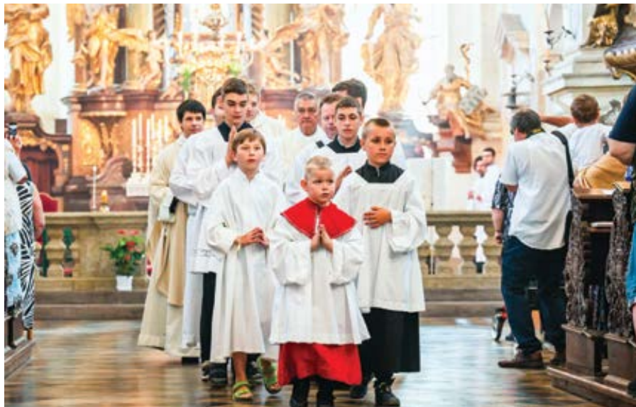
Poutní slavnost Nanebevzetí Panny Marie, Dolní Ročov.

Nálada ve společnosti bohužel posiluje obavy ze střetu mladé a staré ge-