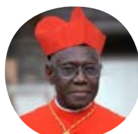
Hlavní host: Robert kardinál Sarah