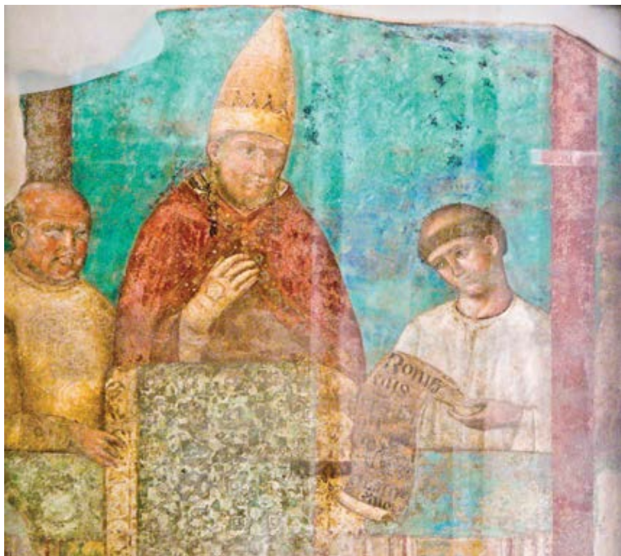
Giotto di Bondone: Vyhlášení prvního Svatého roku papežem Bonifácem VIII. v roce 1300 (1300)

Úspěšné však může být vyústění tohoto ušlechtilého úmyslu pouze tehdy, bude-li předmětem iniciativ a aktivit u příležitosti Svatého roku skutečná nauka koncilních otců. Chybné pojetí koncilu jakožto trampolíny k odrazu, který měl zahájit bezbřehý proces transformace církve, totiž neustále přináší své hořké plody. Roku 2022 vystoupil z katolické církve v Německu dosud nejvyšší počet plátců církevní daně, více než 500 tisíc. Chlácholivá představa, že k otřesům církve docházelo pouze v bezprostředním období po koncilu, zatímco později se situace stabilizovala, nemůže ve světle tohoto až symbolického čísla obstát. Přitom je to právě církev v Německu, která se stále cítí být apoštolem a avantgardou toho skutečného chápání koncilu. Finanční zdatnost německé církve jí navíc