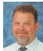
Gary Sullivan Catholic 365 Přeložila Alena Švecová

Po proměnění chleba a vína kněz konsekrovanou hostii rozlomí. Tento obřad se nazývá lámání chleba. Malý kousek vloží kněz do kalicha. Při tom se potichu modlí: „Svátost Kristova těla a jeho krve ať nám slouží k věčnému životu.“ Vložení kousku hostie zpátky do kalicha je znamením Kristova vzkříšení.