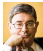
George Weigel novinář, spisovatel, působí v Ethics and Public Policy Center

Takovou „společnou cestu“ by měly Světové dny mládeže podněcovat: společnou cestu, která vede ke Kristu a misi.