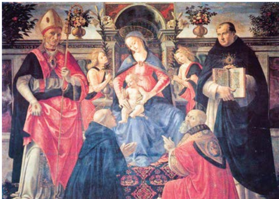
Domenico Ghirlandaio: Madona s dítětem mezi anděly a svatými (1483)

Jsou tu uvedeny dva klíčové body. Zaprvé, je-li člověk špatným prelátem, neměli bychom předstírat opak jen kvůli jeho úřadu. To by podle Tomáše Akvinského bylo přestoupením osmého přikázání – lži. Přirovnává to také k modloslužbě. Obraz Krista nebo světce nemá hodnotu sám o sobě, ale pouze