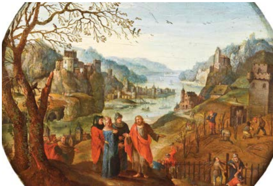
Abel Grimmer: Podobenství o ničemných nájemcích (1565–1625)

Nebo se jeho slova „k mému synu budou mít úctu“ jakoby naplnila na Židech, kteří poznali Krista a uvěřili v něj. A následující slova: Když však vinaři spatřili syna, řekli si: To je dědic. Pojďme, zabijme ho, se naplnila u těch, kteří viděli Krista a poznali ho jako Božího Syna, a přesto ho ukřižovali.