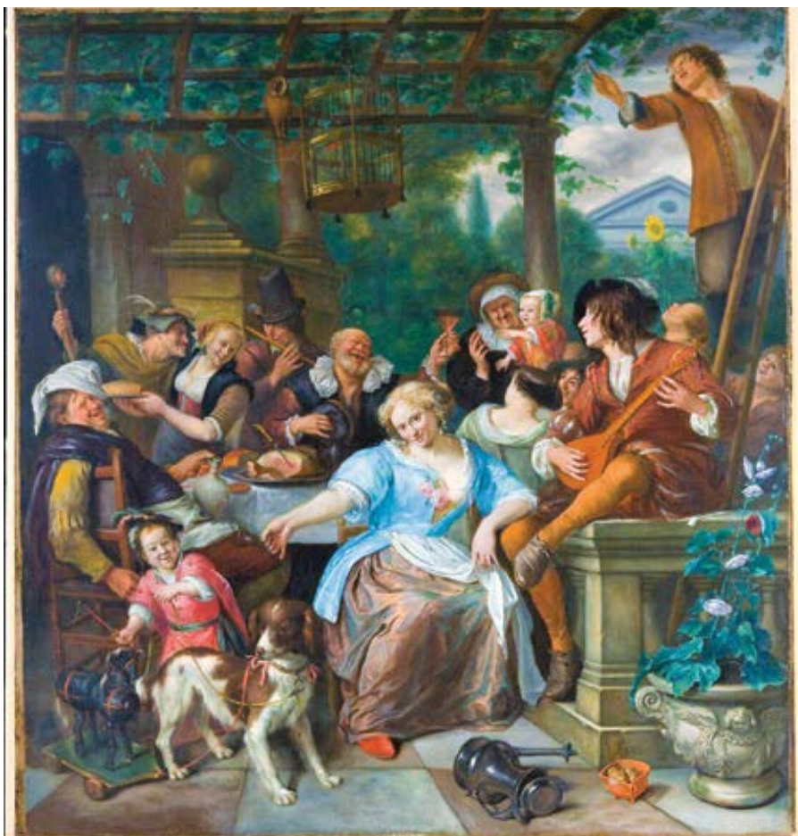
Jan Steen: Veselá společnost na terase (cca 1670)

Církev by pochopitelně nemohla sloužit jako účinné znamení jednoty, kdyby sama jednotu postrádala. Není nutno komentovat dosud nedokončené snahy o jednotu s protestanty nebo do-