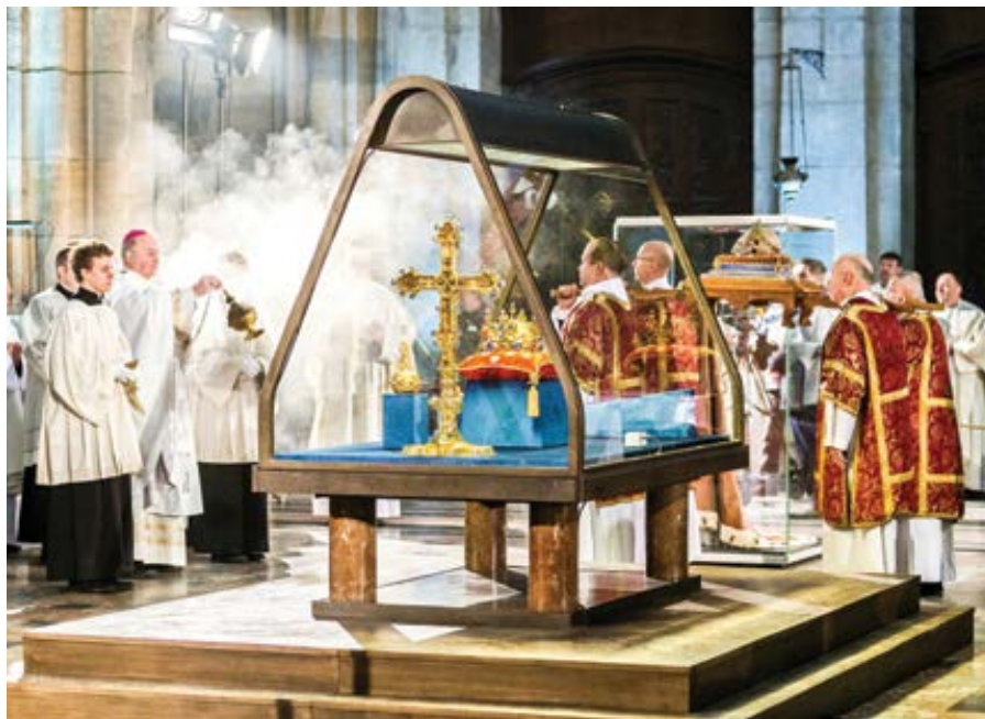
Mše svatá a modlitba za vlast s korunovačními klenoty a lebkou svatého Václava, Praha 22. ledna 2023.

Jedna nejmenovaná farnost v USA doporučuje věřícím nepřijímat svaté přijímání na kolenou. To by nás asi ještě tak moc neznepokojilo, ale když se dozvíme důvod, údiv nebere konce. Během pandemie Covid-19 bylo církvím v mnoha zemích po celém světě přímo nařizováno, aby svaté přijímání bylo podáváno zásadně tzv. na ruku. Mělo být bezpečnější a hygieničtější, bylo to prostě jedno z opatření v době, kdy si skoro nikdo moc nevěděl rady. Tomu se dá při troše dobré vůle snad i rozumět, ačko-