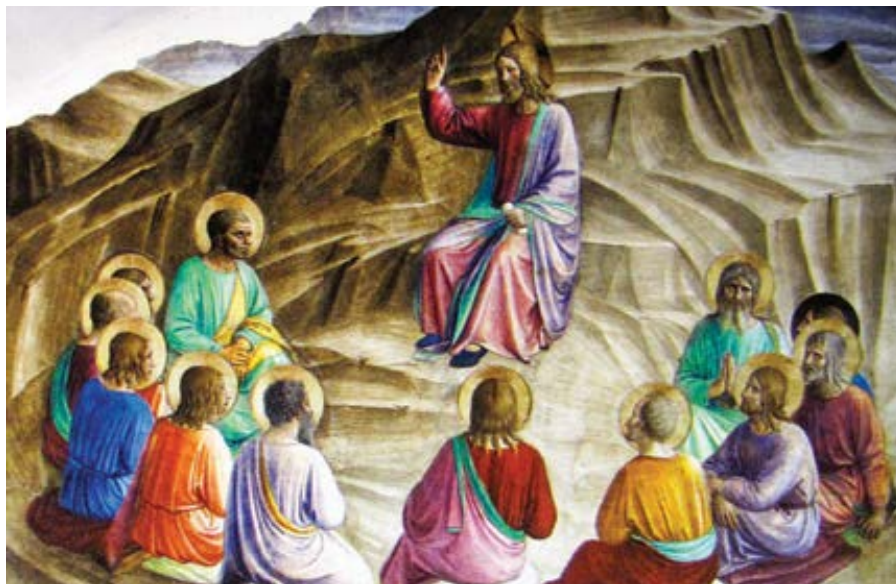
Fra Angelico: Kázání na hoře (mezi 1437 a 1445)

Vlivem vody, slunečního žáru a vanutí větru se také sůl mění v něco jiného. Stejně tak byli apoštolští lidé proměněni k duchovnímu znovuzrození vodou křtu,