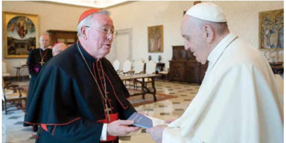
Papež František přijímá 11. června 2021 během audience ve Vatikánu knihu od kardinála Jeana-Clauda Hollericha, předsedy Komise biskupských konferencí Evropské unie.

to výrazů označujících „stejnopohlavní svazky“ dosazujte „POLYAMORNÍ SVAZKY“ nebo „POLYAMORNÍ PŘITAŽLIVOST“: