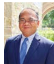
Roland Millare Crisis Magazine Přeložila Alena Švecová

Když je kněz během celé liturgie obrácený k Pánu, symbolizuje to také potřebu všech věřících neustále se při našem novém exodu přeměrovávat zpátky k Pánu. Příležitost k liturgické obnově může znovu začít právě při úvahách o tom, jak můžeme zavést reformu nejvyšší, tj. Conversi ad Dominum! – „Obraťte se k Pánu!“