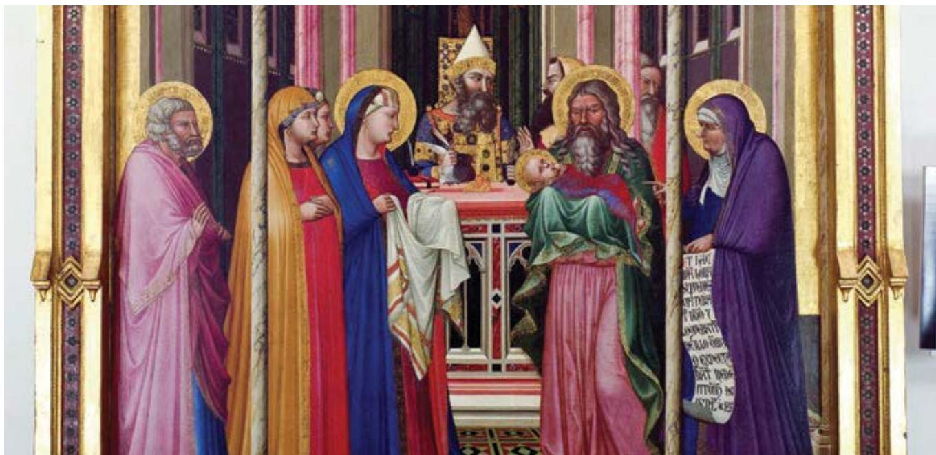
Ambrogio Lorenzetti: Uvedení Páně do chrámu (1342)