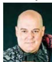
Angelo Stagnaro National Catholic Register Přeložil Pavel Štíčka

přetvářku. Bez ohledu na lži ateistů je však vesmír až příliš dokonale antropický – to znamená, že byl stvořen tak, aby podporoval život člověka. Bez ohledu na to, jak moc ateisté křičí, se vesmír jeví jako příliš složitý a jemně vyladěný k naší podpoře, a proto nemůže být výsledkem slepého, bezmyšlenkovitého, náhodného procesu. A někdy skutečnost Stvořitele prosvítá skrze veškerou uspořádanost vesmíru v podobě zázraků.