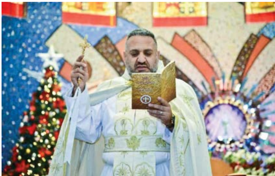
P. Charbel Mhanna OMM.

pacientům v nemocnicích a můžeme se modlit na hřbitovech, jelikož se tam nacházejí hroby pro nemuslimy,“ řekl.