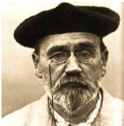
Autoportrét Emila Zoly (1902).

líkům, které by mohl urazit – jeho dobrý přítel papež Pavel III. ho ve skutečnosti nabádal, aby zveřejnil, co objevil. Koperník se spíše obával, že si rozhněvá lidi