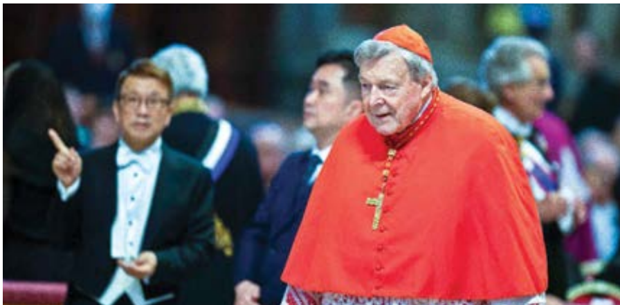
Kardinál Pell na konzistoři ve Vatikánu 27. 8. 2022.

Dokument se však jasně vyjadřuje ke zvláštnímu problému podřízeného postavení žen a k nebezpečí klerikalismu, ačkoli uznává pozitivní přínos mnoha kněží.