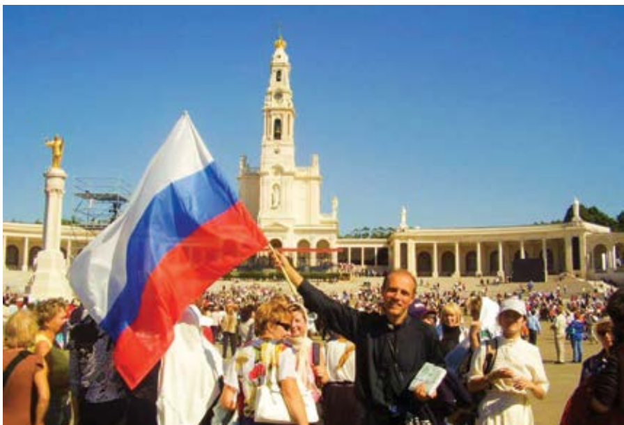
Ruští poutníci ve Fatimě.

opustit) zdatně kontruje personalismus ruského disidenta (a později exulanta) Zamjatina v románu My . A na ruské schizma nejpřesvědčivěji odpovídá Dostojevského žák Vladimir Solovjov jak v knize Ruská církev a papežství , tak v „Legendě o Antikristu“. A pak je tu J. R. R. Tolkien.