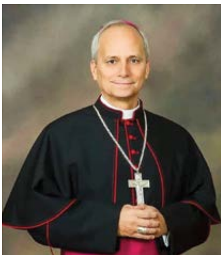
Mons. Robert F. Prevost OSA.

V roce 1987 získal doktorát s prací „Úloha místního převora v řádu svatého Augustina“. V témže roce byl zvolen promotorem pro povolání a ředitelem misí augustiniánské provincie „Matka dobré rady“ v Olympia Fields v Illinois (USA). V roce 1988 byl vyslán do misie v Trujillo jako ředitel společného formačního projektu pro augustiniánské aspiranty z vikariátů Chulucanas, Iquitos a Apurímac. Zde působil jako představený komunity (1988–1992), ředitel formace (1988–1998) a učitel profesů (1992–1998). V arcidiecézi Trujillo byl soudním vikářem (1989–1998), profesorem kanonického práva, patristiky a morálky ve velkém semináři „San Carlos a San Marcelo“.