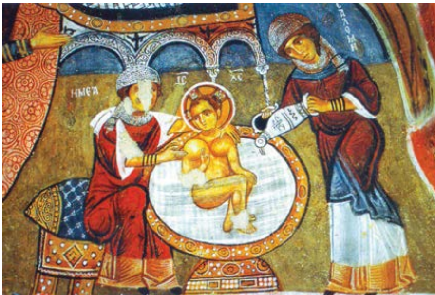
Freska z Kappadokie zobrazující Salome (vpravo) a porodní bábu „Emeu“ (vlevo), koupající novorozence Ježíše (konec 11. st.)

Salome či sv. Marie Salome je také známa jako Zebedeova manželka a matka Jakuba Většího a evangelisty Jana. V Bibli vystupuje jako jedna z Ježíšových následovnic, které byly svědky jeho ukřižování a smrti a o Velikonocích přinesly