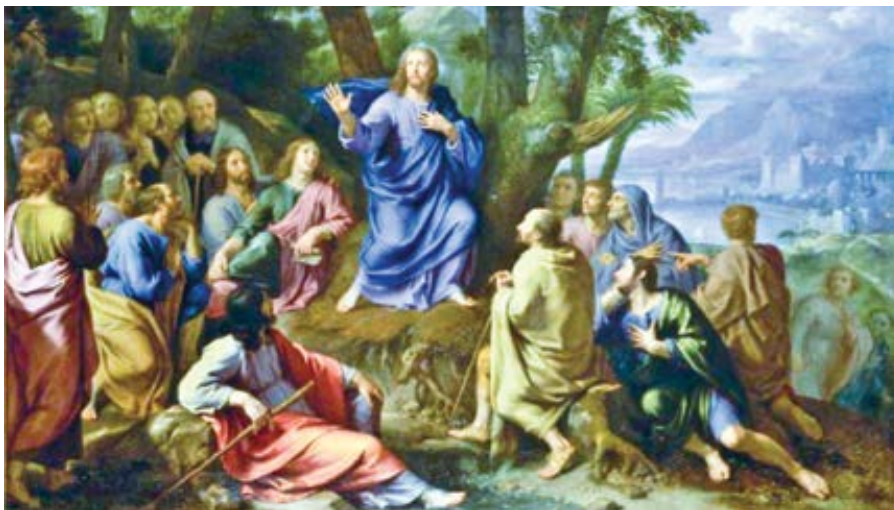
Jean-Baptiste de Champaigne: Kázání na hoře (17. st.)

Kdo by při strážlivějším rozumu řekl králům: Není vaše věc, jestli chce být někdo zbožný nebo svatokrádežný? Jistě jim nelze říci: Není vaší věcí, zda někdo ve vašem království chce být slušný nebo nestydatý. I když je lepší vést lidi k uctí-