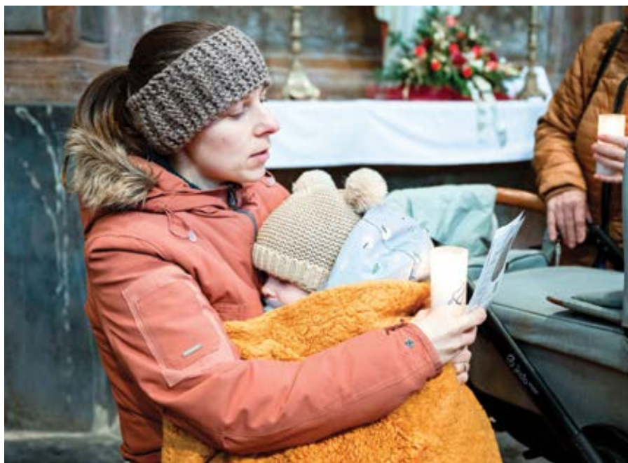
Z Hronniční pouti matek ve Šternberku.

Aktivisté se nezastaví před ničím, zdá se. A budou děti brát rodičům i skrze obstrukce při aplikování náboženské svobody zaručené státem a ústavou. Ale