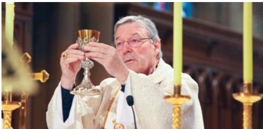
Kardinál George Pell.

Děkujeme Bohu za to, že počet katolíků na celém světě, zejména v Africe a Asii, roste, nicméně v Latinské Americe je situace radikálně odlišná a lidé z církve odchází k protestantům a nebo se z nich stávají sekularisté.