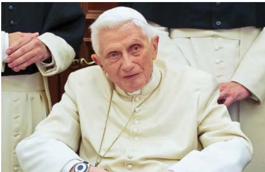
Benedikt XVI. v roce 2019.

Společnost, ve které absentuje Bůh, tedy společnost, která Jej už nezná a zachází s Ním jako by neexistoval, je společností, která ztrácí svoje kritérium. V naší době bylo vymyšleno úsloví „Bůh je mrtev“. Když ve společnosti zemře Bůh, stane se svobodnou, ujišťovali nás. Ve skutečnosti znamená smrt Boha ve společnosti také konec její svobody, protože umírá