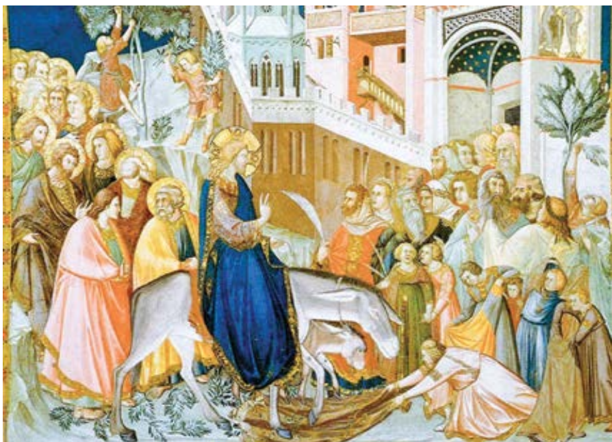
Pietro Lorenzetti: Ježíšův příjezd do Jeruzaléma (1320)

Snad proto nezmiňuje jméno, aby naznačil, že všichni, kdo chtějí slavit pravé Velikonoce a v duchu dát Kristu pohostinství, mají k tomu dostat příležitost.