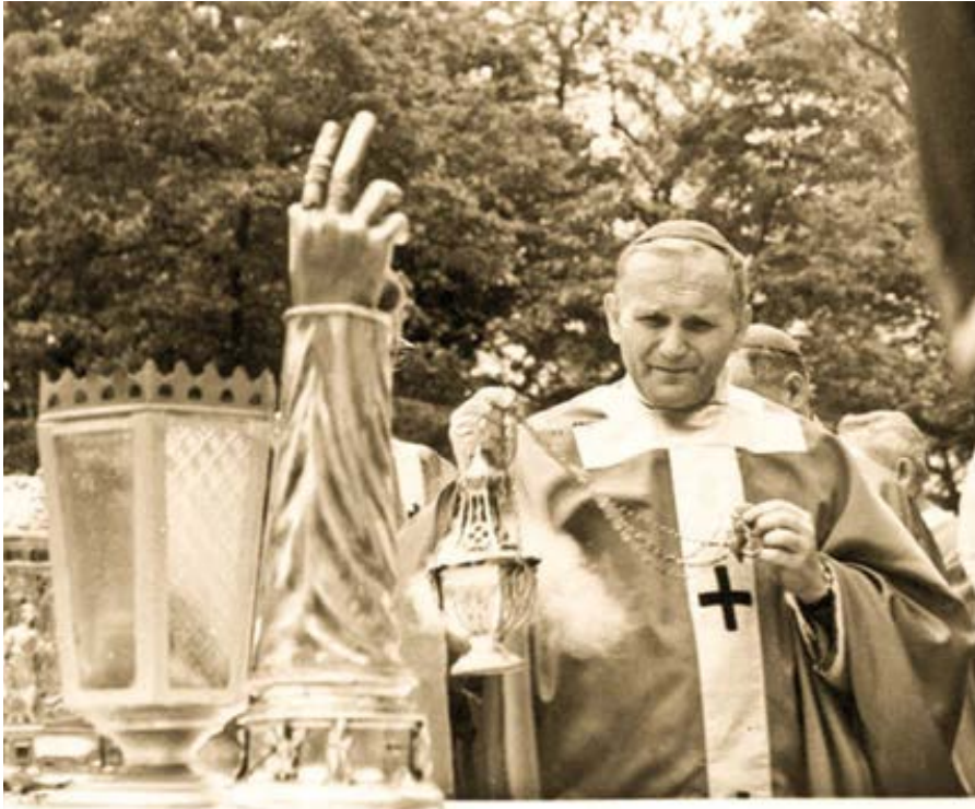
Jan Pavel II. jako krakovský arcibiskup při mši sv. 8. května 1966.

Nemůžeme mlčet k útokům na sv. Jana Pavla II., které se v posledních dnech odehrávají v sousedním Polsku.