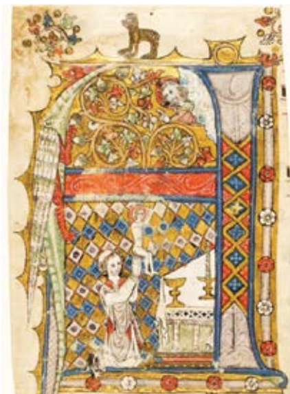
Iniciála A z holandského cisterciáckého graduálu ze 14. století.

(2 Celano, 125): Ďábel nejvíc jása, když může Božímu služebníku vyrvat radost ducha. Nosí s sebou prach a podle libosti jej hází do záhybů svědomí, aby pošpinil čistotu svědomí a ryzost života. Je-li však srdce naplněno duchovní radostí, marně stříká svůj hadí jed. Zlí duchové nezmohou nic proti Kristovu služebníkovu, když ho zastihnou plného svatě radostí. Je-li však mysl malátná, bez útechy a smut-