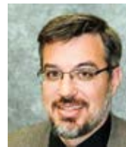
Tom Hoopes Aleteia Přeložil Pavel Štíčka

Církev přináší víru, naději a lásku milionům lidí – a Ježíš potřebuje, aby se k tomuto úsilí připojil každý z nás.