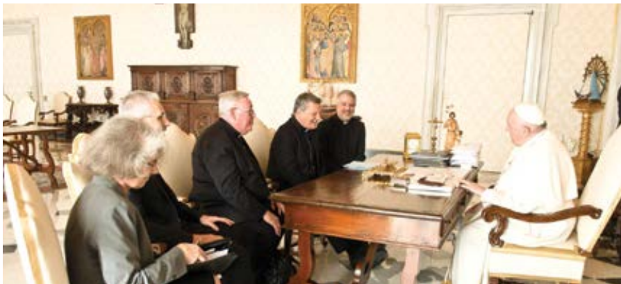
Účastníci setkání ve Frascati, kteří vypracovali dokument kontinentální fáze synody, při audienci u papeže Františka.

Ivereighovo líčení začíná vyznáním, jak byl „ohromen vážností úkolu“ a také, jak „na svých bedrech cítili ruku dějin a tíhu odpovědnosti“. Pokud se objevilo podezření, že synodální proces o synodalitě pro synodální církev bude poněkud „autoreferenční“, Ivereighovo líčení to v plné míře potvrzuje. Určení „odborníků“ – papežští insideři, konzultanti, guruové vedení, specialisté na komunikaci, ekle-