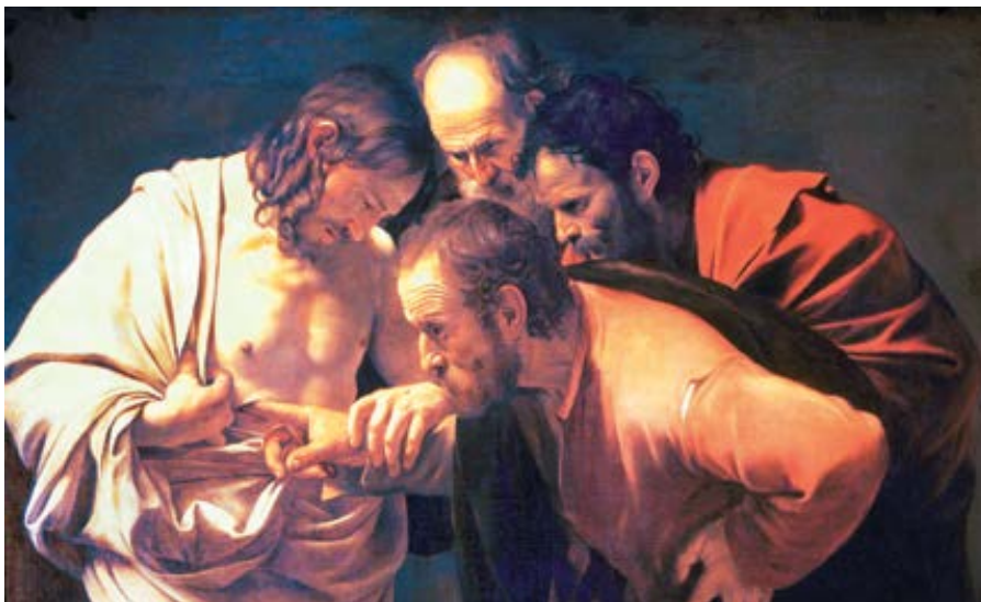
Caravaggio: Nevěřící Tomáš (cca 1601–1602)

Všimněte si dobroty vládce. Ukazuje sebe a své rány i kvůli jedné duši a přichází, aby jednu zachránil. Učedníci mu to nepochybně věrně oznámili a on sám to slíbil. Přesto, když o to požádal jediný Tomáš, Kristus mu to neodepřel. Neukázal se mu však hned, ale až po osmi dnech, aby se po napomenutí v kruhu učedníků roznítil větší touhou a zůstal v budoucnu věrnější; proto je řečeno: Za osm dní byli jeho učedníci opět uvnitř a Tomáš byl s nimi. Ježíš vešel, ačkoli dveře byly zavřené, postavil se doprostřed a řekl: „Pokoj vám!“ Ježíš tedy stál a nečekal, až ho Tomáš vyzeve, ale použil stejná slova, aby ukázal, že je přítomen, když hovoří se svými učedníky. Nejprve ho však pokáral; proto následuje: Pak řekl Tomášovi: „Ježíš je naživu.“ Řekl: „Polož sem prst a podívej se na mé ruce! Natáhni ruku a vlož ji do mého boku! Pak ho pokárá: A nebuď nevěřící, ale věřící! Podívej se, jak nevěřící pochyboval