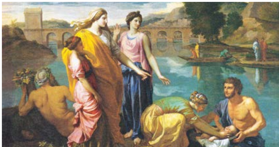
Nicolas Poussin: Nalezení Mojžíše (1638)

Liberální morální opodstatnění práv takto propůjčených Člověku vychází z myšlenek Thomase Painea, zejména z jeho knihy The Rights of Man (Práva