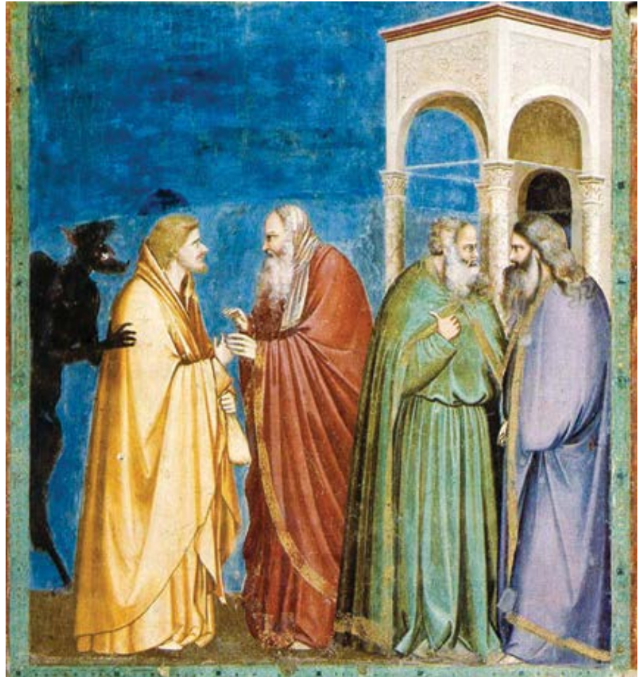
Giotto di Bondone: Jidáš dostává zaplacení za svoji zradu (1306)

Jiní se domnívali, že Jidáš zůstal viset