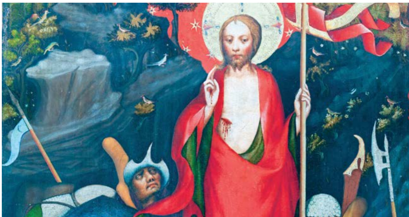
Mistr Třeboňského oltáře: Zmrtvýchvstání (cca 1380)