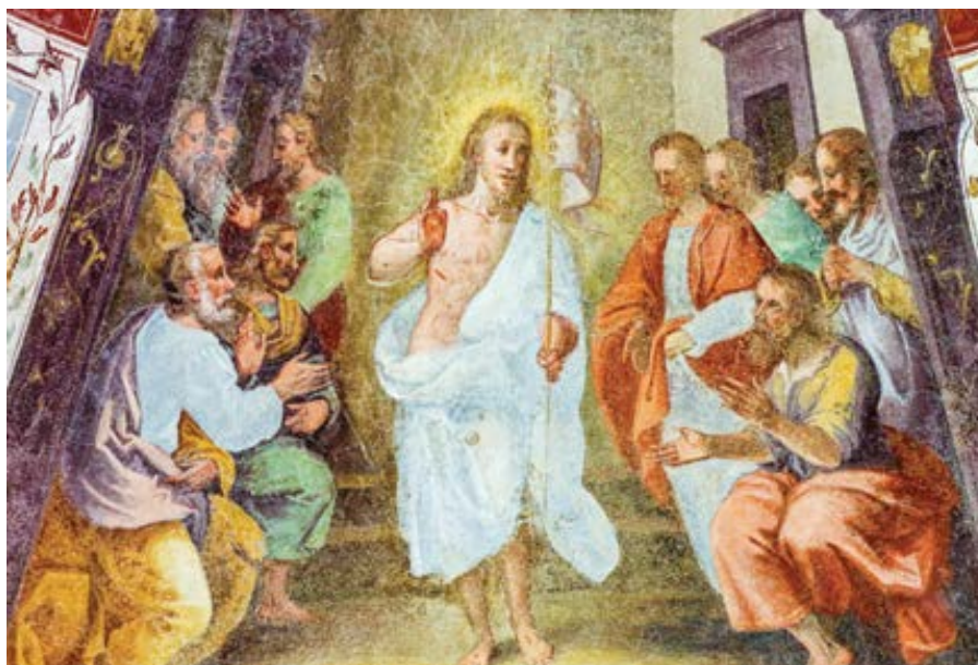
Zmrtvýchvstalý Kristus se zjeví apoštolům. Freska v ambitech Santa Maria Novella ve Florencii.

A Pán se jim zjevil na hoře, aby jim naznačil, že tělo, které narozením vzal z pouhé země lidského rodu, svým vzkříšením pozvedl nad všechny pozemské