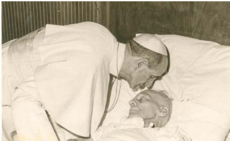
Papež Pavel VI. se pomodlil u zemřelého kardinála Josefa Berana a políbil ho na čelo (17. 5. 1969).

Pražský rodák Josef Václav Myslbek je nejvýznamnější český sochař přelomu 19. a 20. století. Narodil se v roce 1848 v Praze jako syn malíře Václava Myslbeka. Sochařskému umění se učil v ateliéru Václava Levého, kde pracoval až do roku 1870. Zároveň mezi lety 1868 až 1872 studoval na pražské Aka-