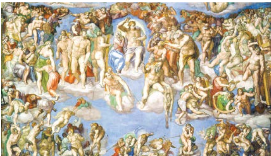
Michelangelo Buonarroti: Poslední soud (1536-1541)

byl reformátorem lidstva. Já jsem však povolán být dobrodincem. Kristus jako moralista rozlišoval mezi dobrem a zlem. Já přinesu mír! On hrozil světu spravedlivým odplácejícím soudem, ale můj soud bude soudem milosti, v němž dám každému, co potřebuje...“ Když dobrodinec na své cestě napokon popře i Kristovo zmrtvýchvstání, zjevuje se mu kovový a chladný hlas Knížete tohoto světa, který ho omámí vidinou Nadčlověka – zrodí v něm Antikrista. Mohli bychom si zase říci: je to opět jen kniha...