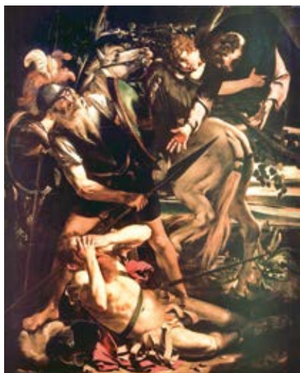
Caravaggio: Obrácení sv. Pavla (cca 1600)

Dnes se chci věnovat úryvku Nového Zákona, kterému teologové říkají „Pavlovo evangelium“, anebo také „Korintské krédo“. Jde o nejstarší biblickou zprávu, která dokládá víru prvotní Církve ve Zmrtvýchvstání Kristovo. Jedná se o 1 Kor 15, 3–8.