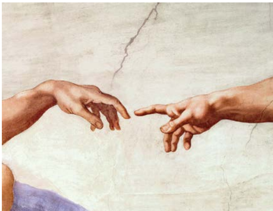
Michelangelo Buonarroti: Dotyk Adama a Boha (1509)

se standardům pro lékaře. Využívá nástroje, které mu byly dány, a uplatňuje je v nesčetných situacích, v nichž se ocitne. Tím, že úspěšně čelí jakémukoli množství problémů a učí se i ze svých neúspěchů, využívá své nástroje a zkušenosti k tomu, aby ze sebe udělal lepšího lékaře.