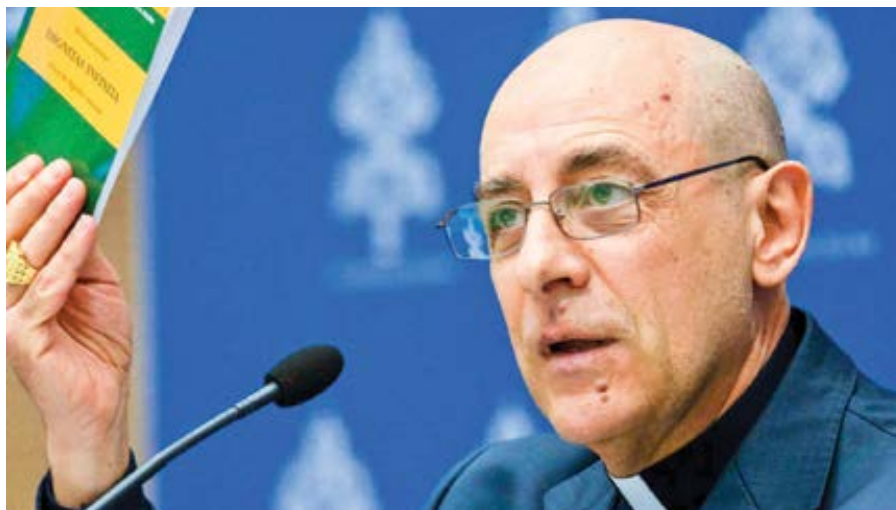
Kardinál Víctor Manuel Fernández, prefekt Dikasteria pro nauku víry, s kopii deklarace „Dignitas Infinita“.

Naše sociální důstojnost se týká spíše naší pozice v lidské společnosti a zahrnuje otázku, jak jsme okolnostmi nuceni žít; jinými slovy, vnější či společenské podmínky našeho života nemusí být naší ontologické důstojnosti hodny. I tady však naše existenční důstojnost může (a měla by) zůstat nedotčena, když těžkosti a nespravedlnost zvládneme, aniž bychom přestali „usilovat o život v pokoji, s radostí a nadějí“. Za zmínku rozhodně stojí také další důraz tohoto textu: Vzhledem