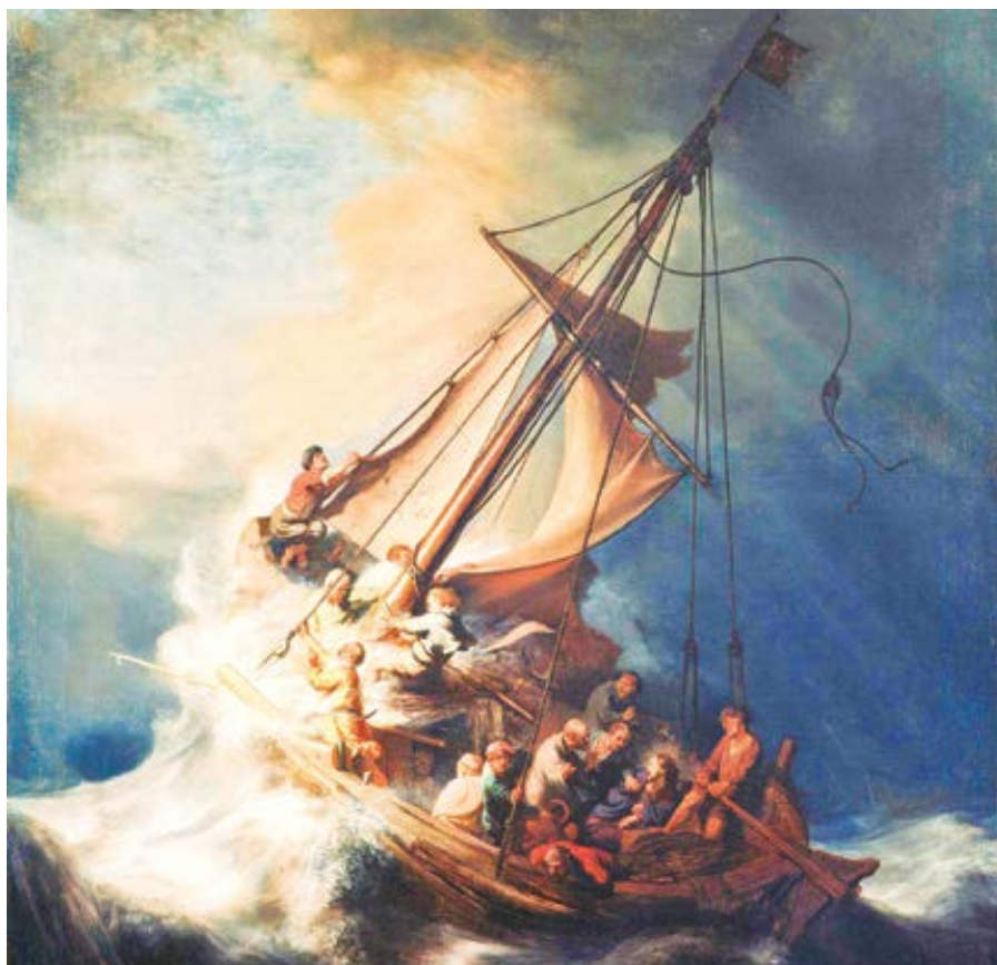
Rembrandt: Bouře na Genezaretském jezeře (1633)

A pohrozil také učedníkům, že nebudou mít víru, neboť následuje: a řekl jim: Řekl jim: „Proč se tak bojíte? Cožpak ještě nemáte víru? Kdyby měli víru, uvěřili by, že i ve spánku je může uchránit. Přepadl je velký strach a řekli si mezi sebou: „Nebojte se! Kdo si myslíš, že je, že ho poslouchá vítr i moře? Měli o něm totiž pochybnosti. Když uklidnil moře příkazem, ne holí jako Mojžíš, ani modlitbami jako Eliša Jordánský, ani archou jako Jozue, syn Nunův, zdálo se jim, že je opravdu Bůh, ale od té doby, co spal, člověk.