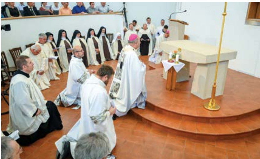
Svěcení klášterního kostela sv. Terezie z Avily v Drastech 8. června 2024.

lu očekává Brzobohatá, Dočekal nebo Prchal. Za to jistou nadějí dává Veselý a Ostrá. Snad bych také doporučil, aby v případě zvolení, vedle sebe neseděli Kouřil s Krabičkou a Teplý s Chladem. Sázkou na jistotu je naše fauna. Volit můžeme Wolfovou i Volfovou, Vlka i Vlčka, Ježka, Sršně, Vokounovou, Kolouška i Lišku, (...) Straku, Havránkovou, Sýkoru, Holuba, Čejku, Čápa, Sokolovou, Brhlíka, Slavíčka, Sokola, Orla, Slavíkovou, Sojku, Brabcovou, Strnada, Dlaska a Skřivánka.“