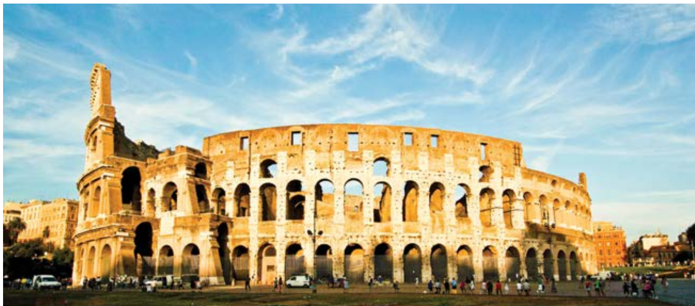
Nápis na průčelí římského Kolosea: „Amfiteátr, zasvěcený triumfům, zábavám a bezbožnému uctívání pohanských bohů, je nyní zasvěcen utrpení mučedníků očištěných od bezbožných pověr.“