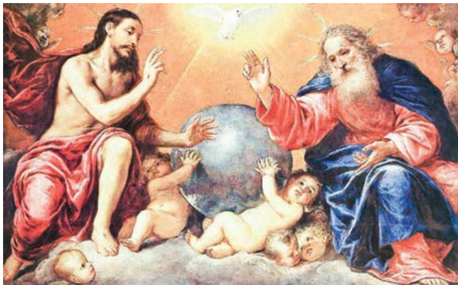
Antonio de Pereda: Nejsvětější Trojice (1. pol. 17. st.)

A není právě to ústředním poselstvím Dignitas Infinita – že určité skutky a postoje se s lidskou důstojností neslučují? Když s druhými lidmi jednáme s pohrdáním, prohřešujeme se proti jejich důstojnosti a snižujeme tím i tu svou. Když se chováme tak, že to narušuje naši důstojnost, znevažujeme sami sebe, ztrácíme důstojnost.