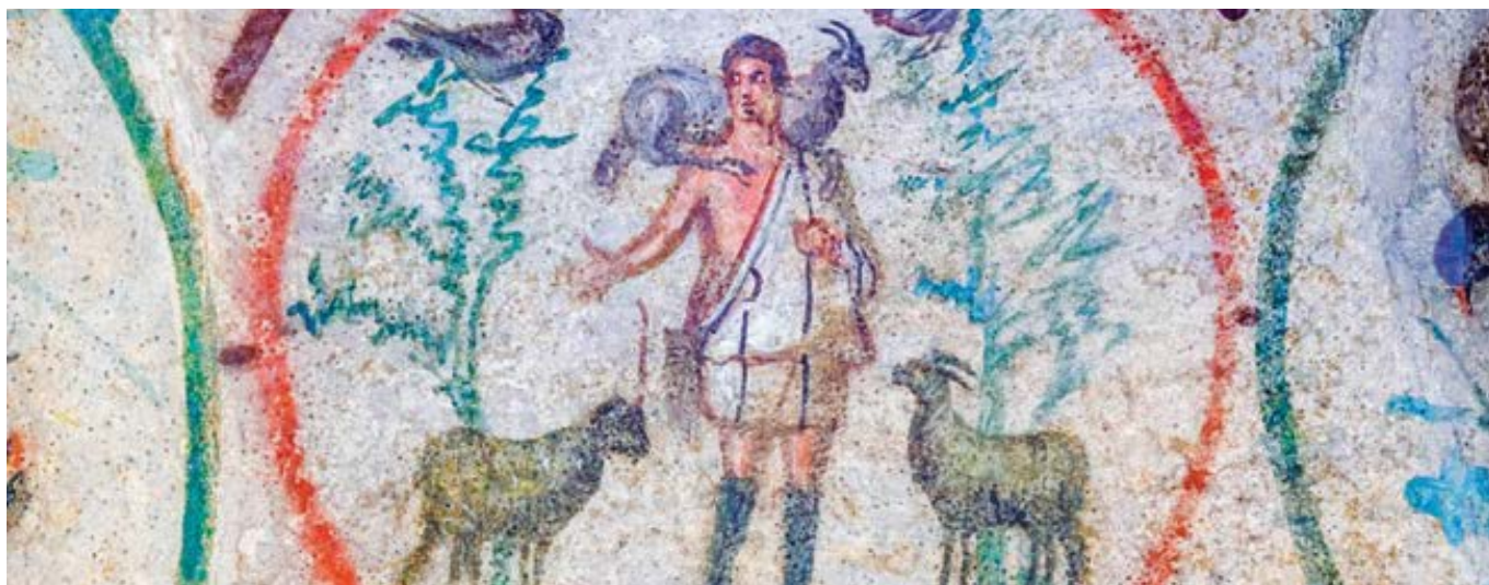
Katakomby sv. Priscily.