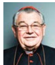
kardinál Dominik Duka OP emeritní arcibiskup pražský

kardinál Dominik Duka OP blog.idnes.cz/duka