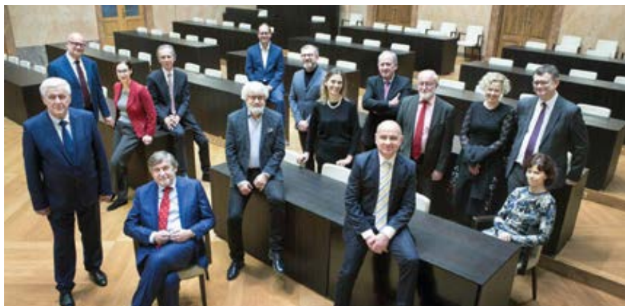
Plénium Ústavního soudu.

Slovo „soud“ má společný kořen se slovem „soudnost“. Soudný ústavní soud by musel v této kauze konstatovat jednoduchou pravdu, že pohlaví nelze měnit. A že nelze po státu požadovat, aby sebedeklaratorní „změnu“ pohlaví úředně jen tak respektoval. Ústavní soud svým rozhodnutím vlastně říká, že pohlaví měnit lze. Příště čekejme od Ústavního soudu rozhodnutí, že si lze svévolně měnit i věk. Nebo že má člověk právo být považován za dva lidi. Sevším všudy, i s nárokem na dva důchody nebo na dva hlasy ve vol-