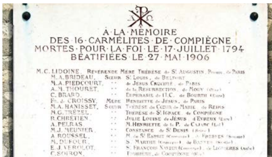
Mramorová náhrobní deska na pařížském hřbitově Picpus se jmény obětí.