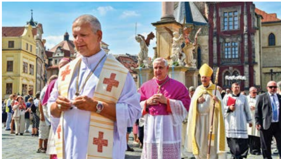
O svátku Nanebevzetí Panny Marie požehnal pražský arcibiskup Jan Graubner nová sousoší andělů na staroměstském Mariánském sloupu.

„Konzervativní spolek Aliance pro rodinu, který vystupuje proti LGBTQ lidem a stejnopohlavním manželstvím, se v posledních týdnech pustil do boje proti zvyšování koncesionářských poplatků. Spustil petici a také reklamy na sociální síti Facebook. Z dat přitom vyplynulo, že jako inzerent placených příspěvků je vedený pracovník plzeňské diecéze, kterou vede biskup Tomáš Holub. Ten Deníku N řekl, že je angažmá jeho podřízeného v činnostech Aliance pro rodinu nepřijatelné. Situaci chce dál řešit,“ citujeme Deník N . Finální řešení neznáme, ale skutečně jsme už svědky situace, kdy se za pomoc organizacím, které brání normální svět, postihuje i v prostředí římskokatolické církve? Učení církve například v oblasti homosexuální agendy trpělivě vysvětluje papež František, když říká, že „zákony, které trestají homosexualitu v některých zemích světa, jsou nespravedlivé“, zároveň však opětovně potvrdil učení církve a uvedl, že praktikování