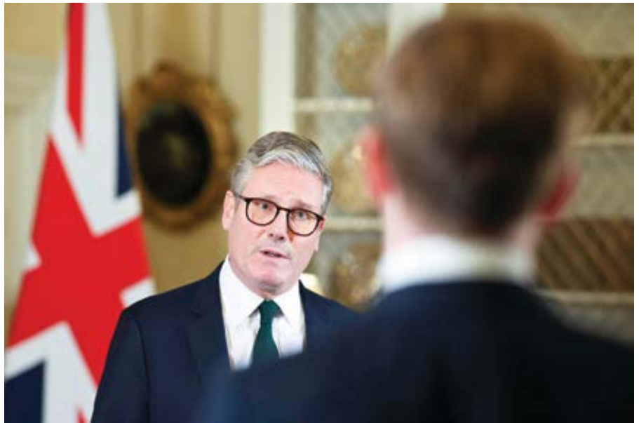
Britský premiér Keir Starmer.

Rozbuška byla nešťastná. Kluk jménem Axel Rudakubana, jemuž je dnes osmnáct let, narozený ve velšském Sheffieldu rodičům, kteří se přistěhovali z Rwandy, ubodal v umělecké škole tři děvčata ve věku 6, 7 a 9 let a dalších nejméně 8 vážně zranil. Podle všeho to ne-