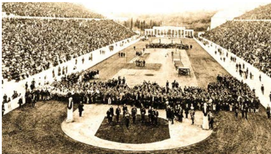
Zahajovací ceremoniál letních olympijských her v Aténách v roce 1896.

Pavla navštívit Olympii i celý tento areál, který sportovci udržují jako chrám.