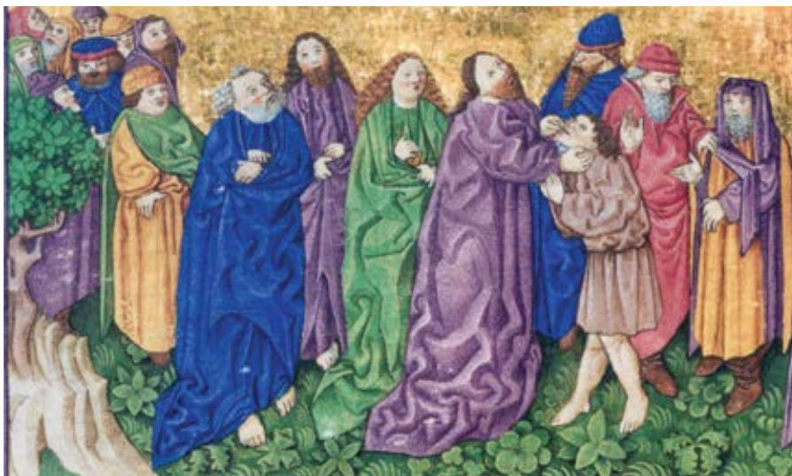
Ottheinrichova Bible: Uzdravení hluchoněmého (1425–1430)

Neboť hluchoněmý je ten, kdo nemá uši, aby slyšel Boží slovo, a neotevřelá ústa, aby mluvil: takové musí přivést k Pánu ti, kdo se již naučili mluvit a sly-