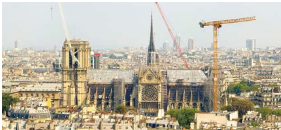
Pohled na pařížskou katedrálu Notre Dame ukazující postup výstavby v červenci 2024.