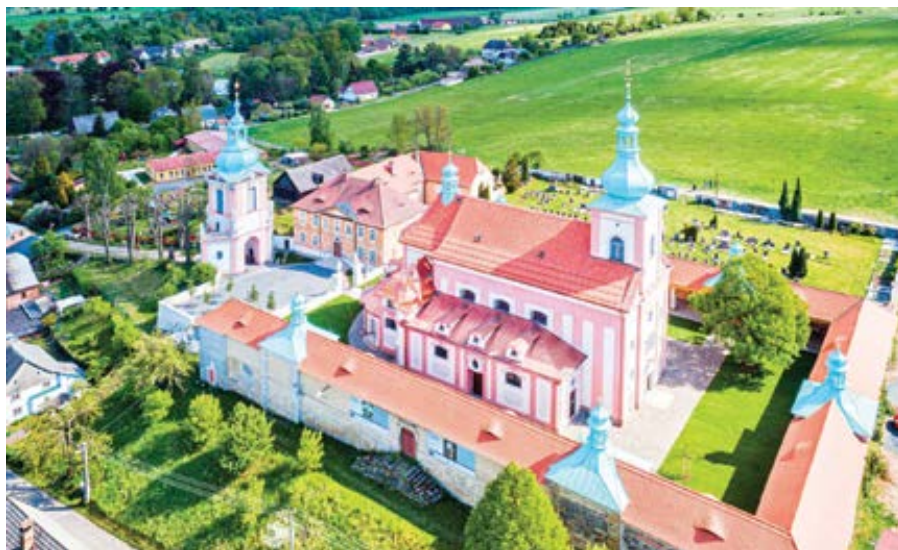
Poutní areál a kostel Navštívení Panny Marie v Horní Polici.