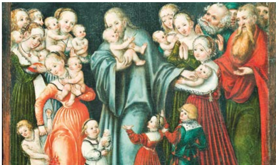
Lucas Cranach mladší: Kristus zehná dětem (1545–1550)

Buď jednoduše ukazuje, že ten, kdo chce být větší, má přijímat Kristovy chudé s úctou kvůli němu samému, nebo má být malý ve zlobě a zachovat si prostotu bez povýšenosti, lásku bez závisti a oddanost bez hněvu. A když objímá dítě, naznačuje, že pokorní jsou hodni jeho objetí a lásky. A dodává „ve jménu mém“, aby ctnosti, které dítě přirozeně má, usilovalo získat pro jméno Kristovo úsilím rozumu. A když učil, že v dětech ho přijímají, aby si nikdo nemyslel, že je jen tím, co viděl, dodal: a kdo mě přijímá, nepřijímá mě, ale toho, který mě poslal, neboť chce, abychom věřili, že je stejný a stejně velký jako Otec.