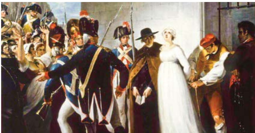
William Hamilton: Poprava Marie Antoinetty (1794)

Přestože někteří historici dychtí dokázat, že Marie Antoinetta měla mimomanželský poměr se švédským diplomatem, důkazy o královnině vrouci katolické víře se objevují i nadále. Nedávno byl v Paříži vydražen misál pro Svatý týden zesnulé královny Marie Leszczyňské, babičky Ludvíka XVI. Kniha