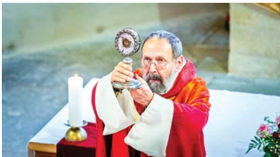
Svatoludmílská pouť na Levém Hradci.

Pojďme k dobrým zprávám. Britská labouristická vláda prodloužila zákaz prodeje „blokátorů puberty“ nezletilým o další tři měsíce. Již dříve, letos v květnu, zavedla tehdejší vláda Konzervativní strany dočasné právní předpisy, podle nichž byla od června v Anglii, Walesu a Skotsku omezena možnost prodeje „blokátorů puberty“ nezletilým. Nová levicová vláda Labouristické strany, jmenovaná po parlamentních volbách konaných v červenci, oznámila pokračování dosavadní politiky ochrany mládeže, v důsledku čehož byl na konci srpna zákaz prodloužen o další tři měsíce. Oblast působnosti byla rozšířena také na Severní Irsko, na které se dříve nevztahovala. V Polsku byl podobný návrh zákona připravený Institutem Ordo Iuris jednomyslně předložen k dalšímu projed-