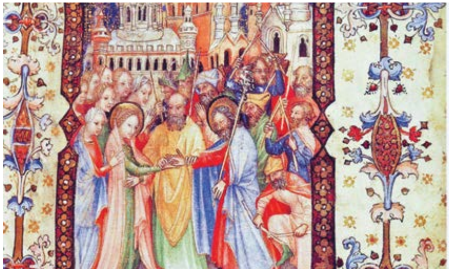
Giovannino de' Grassi: Sňatek Panny Marie (15. st.)

Pokud jde o pravdivost této věci, nezáleží na tom, zda Pánovi, který zakázal rozvod a potvrdil svůj výrok Zákonem, položil otázku o dopisu povolení právě ten zástup, kterému Mojžíš rozvod povolil, jak