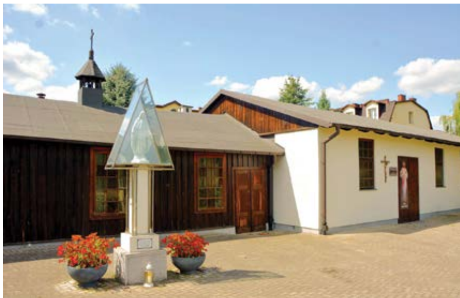
Zrekonstruovaná dřevěná kaple v Niepokalanowě z roku 1927.

všech pod ochranou a prostřednictvím Panny Marie Neposkvrněné. Zvláštním způsobem sv. Maxmiliánovi záleželo na obrácení zednářů a explicitně je jmenoval v upravené modlitbě ze zázračné medailky: „Ó Maria, beze hříchu počatá, oroduj za nás, kteří se k Tobě utíkáme, i za všechny, kteří se k Tobě neutíkají, a zvláště za zednáře“ (současná verze zní „... zvláště za nepřátele Církve svaté a za ty, kdo jsou Ti svěřeni“). Nejde tedy o likvidaci nepřátel, ale o jejich obrácení, tedy jejich záchranu před peklem a získání pro Boží království. Krásně se tato myšlenka spojuje s poselstvím Panny Marie z Fatimy, kde Matka Boží vybízí k modlitbě za ubohé hříšníky. Dalo by se říci, že sv. Maxmilián odpověděl na fatimskou výzvu jako první.