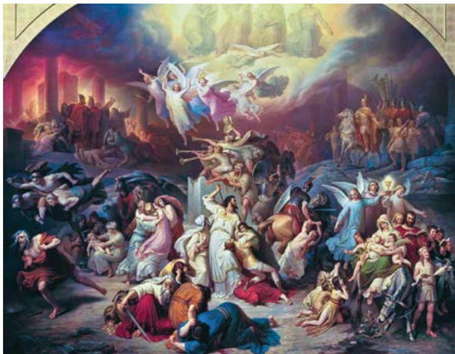
Wilhelm von Kaulbach: Titus ničí Jeruzalém (1846)

Nebo jinak. Pokud pečlivě porovnáme a prozkoumáme vše, co tři evan-