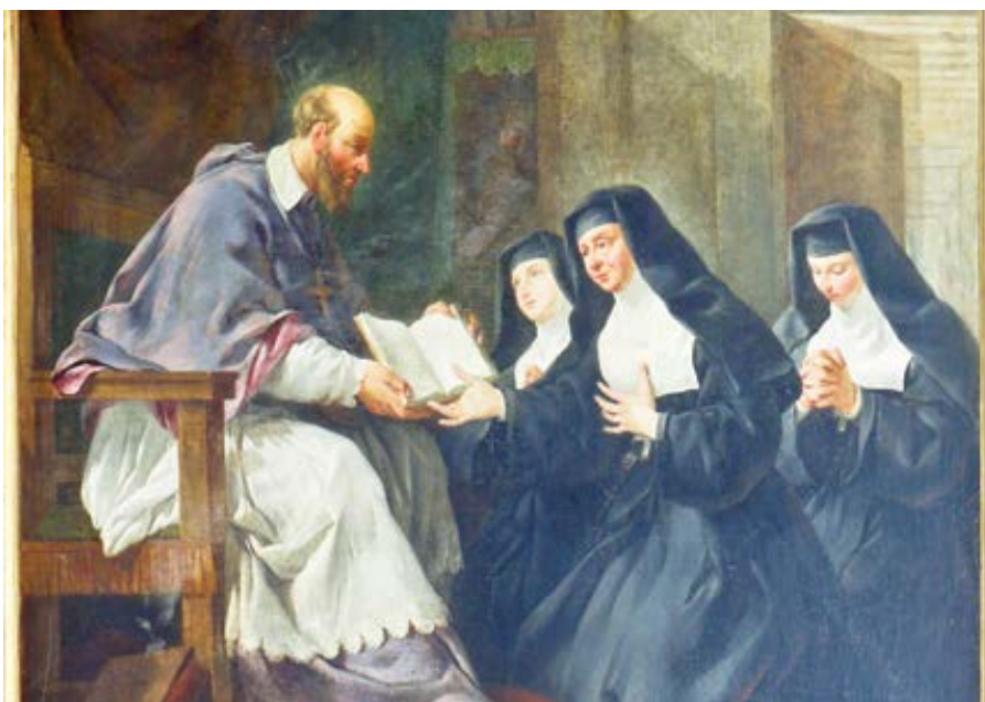
Noël Hallé: Svatý František Saleský předává řeholi sestřím Navštívení Panny Marie (18. st.)

O svatých si často myslíme, že jsou to oslavovaní „nahlídké“ – že jejich život se vyznačuje blažeností, zázraky a dlouhou řadou skutků dobré vůle, někdy přerušenu mučednickou smrtí, která je líčena téměř jako sladké požehnání. Svatý Fran-