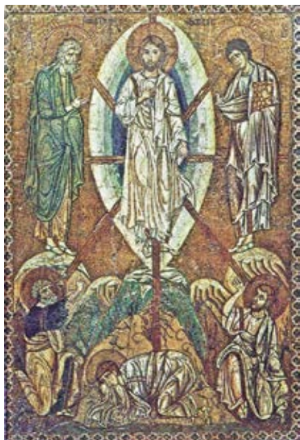
Mozaika z raného 13. st. v pařížském Louvru: Proměnění Páně.

poslán Otcem (Jan 20,21). A právě tato návaznost poslání apoštolů na poslání samotného Krista je nejhlubším základem apoštolské důstojnosti, tedy svátostného kněžství. Poslání apoštolů má tak svůj nejvlastnější původ v samém nitru Nejsvětější Trojice! Z toho důvodu není možné v církvi jakožto v Božím lidu jiné poslání než od Krista. On sám se zcela ztotožňuje s činností apoštolů při plnění jejich poslání, když říká: „Kdo vás slyší, mne slyší; kdo vámi pohrdá, mnou pohrdá, a kdo pohrdá mnou, pohrdá tím, který mě poslal“ (Lk 10,16). Poslání apoštolů je tedy v Božím plánu ztotožněno s posláním Kristovým, když jsou Kristem posláni tak, jak on sám byl poslán Otcem (Jan 17,18). Apoštolský úřad, jejich poslání, proto pramení z Nejsvětější Trojice. Cokoli, co nemá tento původ, není hodno jména apoštolů. Proto pověření službou ze strany církevního shromáždění, jak je běžné v protestantských komunitách, nemá s posláním od Krista vůbec nic společného!