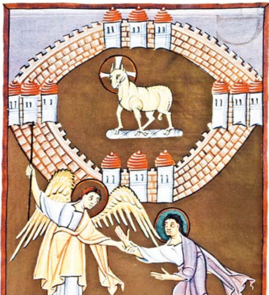
Bamberská Apokalypsa: Nový Jeruzalém (cca 1000)

chovní život určuje zpravidla jeden kněz a jedna farní rada a lidé nemusí se vším souhlasit, ale chtějí-li zůstat ve své obci, nic jiného jim nezbyvá. Pokud se ve své farnosti silně nepohodnou, často se tak trochu rozejdou i s církví. Duchovně se tak situaci vesnice blíží i ta města, která mají jen jednu farnost. Život na venkově je jistě klidnější a tradičnější, ovšem internet a mobily jsou dnes i v té nejzapadlejší vesničce, takže dosah kulturních kolonizací je plošný. Lidé se dnes často stěhují i z velkoměst na předměstí a do blízkých vesnic a městeček tj. dochází k tzv. suburbanizaci, především kvůli cenám nemovitostí, ale i kvůli lepšímu rodinnému životu. Jiné regiony se naopak celé vylidňují, mladí lidé tam nezůstávají. Zdá se tedy ale, že venkovské farnosti samy o sobě do budoucna oproti městům žádnou zásadnější výhodu mít nutně nebudou. Idyla tradičního, katolického venkova třeba na Moravě je navíc často