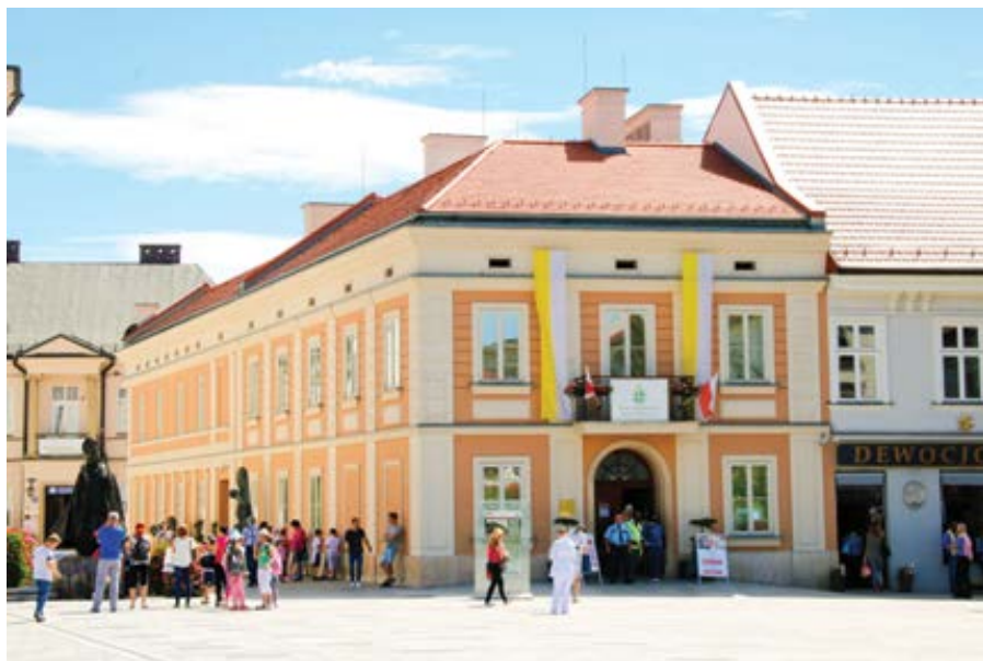
Rodný dům papeže sv. Jana Pavla II.

nám, navštěvoval nás ve Wadowicích a vzal nás do Říma, do Vatikánu a do Castel Gandolfa.