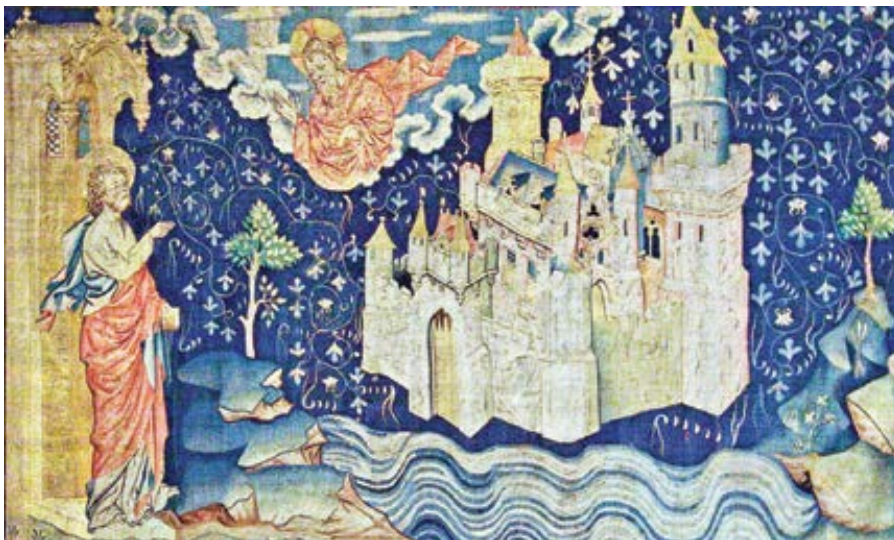
Jan z Patmu se dívá na Nebeský Jeruzalém (tapisérie ze 14. st.)

Tehdy se mi to zdálo vůči té mamince jako dost tvrdá řeč. Měli jsme v té době děti na střední škole a byly hodně zapojeny také v naší farnosti. Jenže současně jsem si uvědomil, že ten kněz má asi pravdu. Kniha sv. Augustina De civitate Dei contra paganos je sice do češtiny často překládána názvem O Boží obci , ale anglický překlad je jasný – The City of God . Obrazem církve je město, nebeský Jeruzalém. Augustin sám napsal toto dílo jako reakci na vyplenění města Říma Vizigóty, pohany. Ovšem samo slovo pohan – latinsky paganus tj. osoba žijící daleko od města neboli „venkovan“ – odráželo skutečnost, že křesťanství se první dostalo do měst, a následně z měst pronikalo i do venkovských oblastí. V dobách rozkvětu tak docházelo k urbanizaci, „poměšťování“ Evropy, zatímco v dobách války a úpadku byla města ničena a vypalována, lidé z nich utíkali, a docházelo tak k ruralizaci, „zvesničení“. V dnešní době kulturních válek mnozí rovněž po-