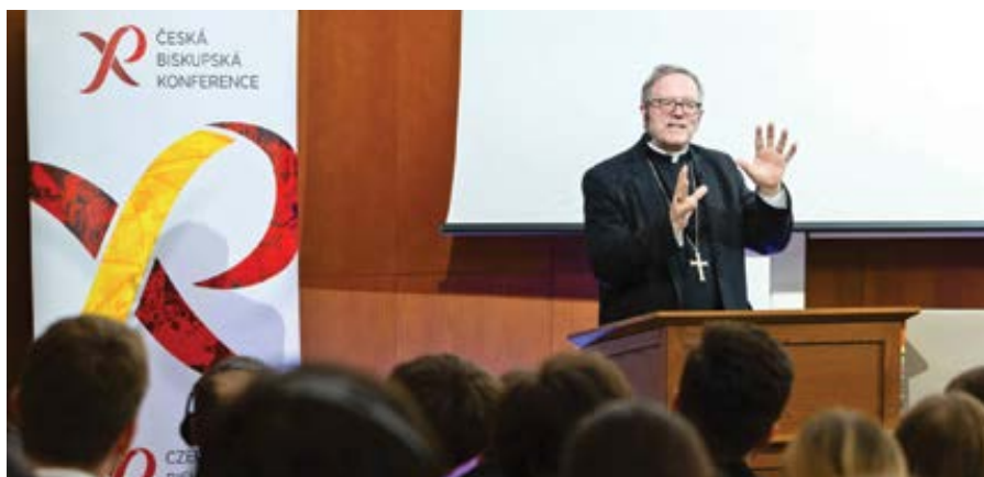
Na FF UK v Praze přednášel na pozvání ČBK studentům a akademické obci americký biskup Robert Barron na téma Ipsum Esse a sociální nauka církve. Záznam přednášky je k dispozici na Youtube kanálu Církev.cz.

Na facebookové stránce účtu Kult smrti najdete mj. velmi dobré analytické příspěvky, které se týkají problematiky tranzice, genderu a homosexuálního aktivismu: „Progresivní levicové a džender-ideologické stránky včera (12. října, pozn. red.) oslavovaly druhé výročí zastřelení dvou homosexuálů v Bratislavě. Píšu oslavovaly, protože ta radost z ‚důkazu‘ o tom násilném útlaku LGBTQI+ ze všech příspěvků doslova stříkala na všechny strany. Co ale obvykle tajupně