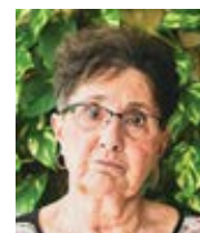
Věra Eliášková dramaturgyně a scénáristka