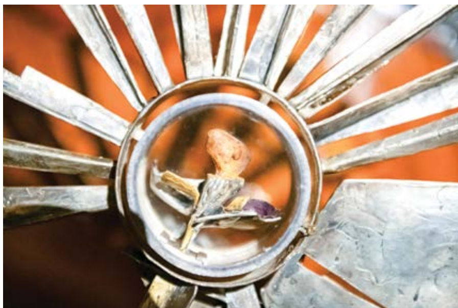
Relikviář s ostatkem sv. Anežky České. Ke svatořečení došlo 12. listopadu 1989 ústy papeže Jana Pavla II. Letos od této události uplynulo 35 let.

Když jsme narazili na osobnost papeže Benedikta XVI., můžeme si dát k přemýšlení jeden jeho citát z knihy vydané nakladatelstvím Paulínky ještě pod jeho kardinálským jménem Joseph Ratzinger s názvem Boží světlo v naší