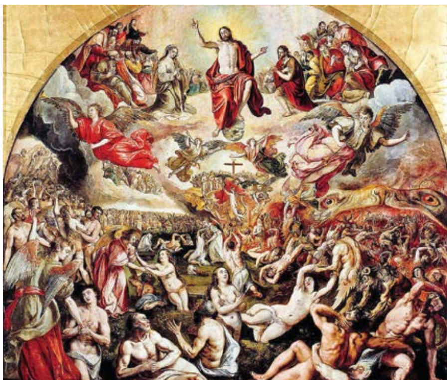
Maerten de Vos: Poslední soud (1570)

Ale vy řeknete: Kvůli vašemu utrpení musíme říci, že konec je již zde, neboť se naplňuje, co bylo předpovězeno. Je totiž jisté, že v naší době není země ani místo bez soužení a zmatků. Jsou-li však tato zla, jimiž nyní trpí lidský rod, jistým znamením, že Pán již přichází, co znamenají slova apoštola, když promluví: Je pokoj a jistota (1Sol 5,3)? Podívejme se tedy, zda by snad nebylo lepší chápat tuto předpověď tak, že se nyní nenaplnuje, ale že spíše přijde, až bude na celém světě takové trápení, že se bude týkat církve, která bude trápena po celém světě, a ne těch, kteří ji trápili, neboť řeknou: „Je tu