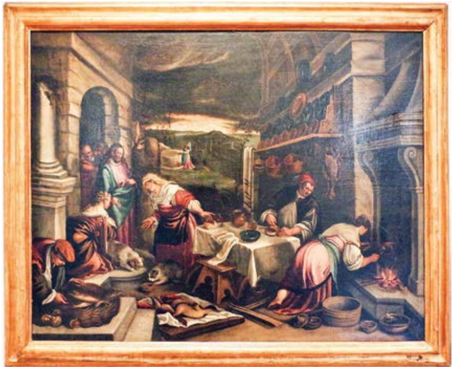
Jacopo a Francesco Bassano: Kristus v domě Marty a Marie v Betánii (cca 1610)

Když šel Ježíš s učedníky dál, vešel do jedné vesnice. Tam jej přijala do svého domu žena jménem Marta, která měla sestru Marii; ta si sedla k nohám Ježíšovým a poslouchala jeho slovo. Ale Marta měla plno práce, aby ho obsloužila. Přišla k němu a řekla: „Pane, nezáleží ti na tom, že mne má sestra nechala sloužit samotnou? Řekni jí přece, ať mi pomůže!“ Pán jí odpověděl: „Marto, Marto, děláš si starosti a trápíš se pro mnoho věcí. Jen jednoho je třeba. Marie volila dobře. Vybrala si to, oč nepřijde.“