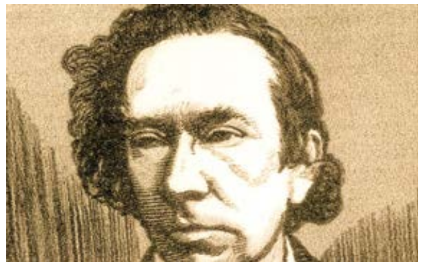
Ernest Hello.

Takový je stav světa, že se zdá podivné, bizarní a úžasné, připomínáme-li prostá slova Ježíše Krista: „Otče svatý, za-