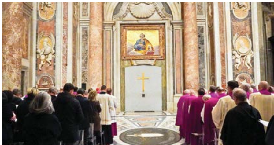
Slavnostní odhalení Svaté brány vatikánské baziliky sv. Petra před Jubileem 3. prosince 2024.

Tak si upřesněme jen namátkou vyhledaná stanoviska Svatého otce: titulke z Radia Vatikán z 20. května tohoto roku: „Církev je otevřená všem, ale homosexuální svazky nemůže zehnat.“ Svatý otec „opětovně potvrdil učení církve a uvedl, že praktikování homosexuality je hříchem“. „Být gayem není zločin,“ řekl agentuře AP. „Není to zločin. Ano, ale je to hřích. Dobře, ale nejprve rozlišujeme mezi hříchem a zločinem,“ dodal. František citoval Ka-