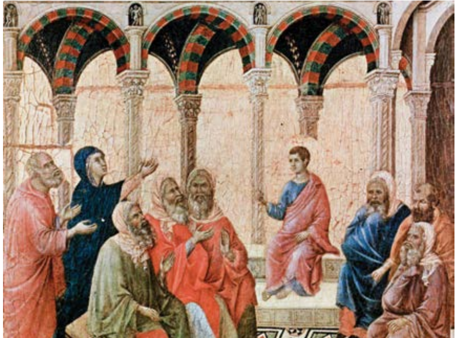
Duccio di Buoninsegna: Dvanáctiletý Ježíš v chrámě (1308–1311)

Protože byl ještě dítě, našli ho mezi učiteli, které posvětil a učil; proto se říká, že seděl mezi učiteli, poslouchal je a kladl jim otázky. Z úcty, aby nás poučil, že ačkoli jsou děti moudré a vzdělané,