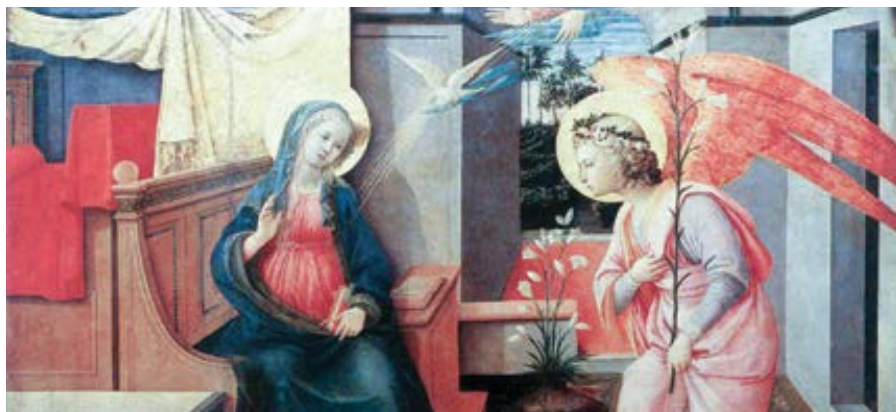
Filippo Lippi: Zvěstování (1445–1450)

kerou máme, my lidé, všichni společnou a zároveň se zde objevuje zcela jedinečný člověk, neboli osoba. Při početí Božího Slova v lůně Panny Marie působením Ducha svatého se nová osoba nevytvořila, protože je zde od věčnosti. Jinými slovy, Druhá Božská Osoba, Syn, Boží Slovo, přijímá naši lidskou přirozenost nezatíženou hříchem, a stává se zároveň i lidskou osobou, protože má lidské tělo a lidskou duši. Lze to také nazvat spojením Božské a lidské přirozenosti v jediné osobě Božího Syna.