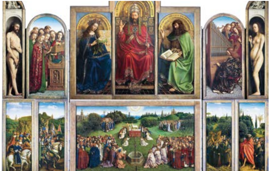
Jan van Eyck: Gentský oltář (1432)

Konečně ať člověk, který chce následovat, naslouchá hodině, v níž má ná-