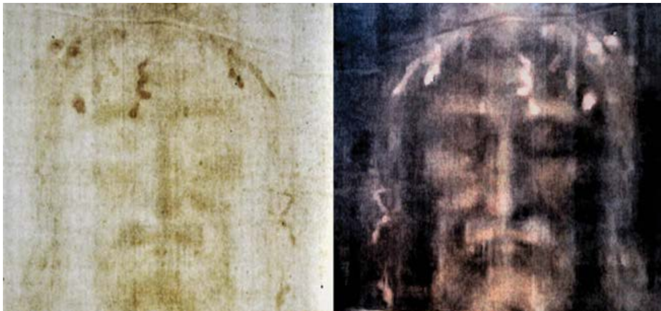
Turínské plátno (pozitiv a negativ).