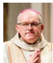
Mons. Josef Nuzík arcibiskup olomoucký a metropolita moravský