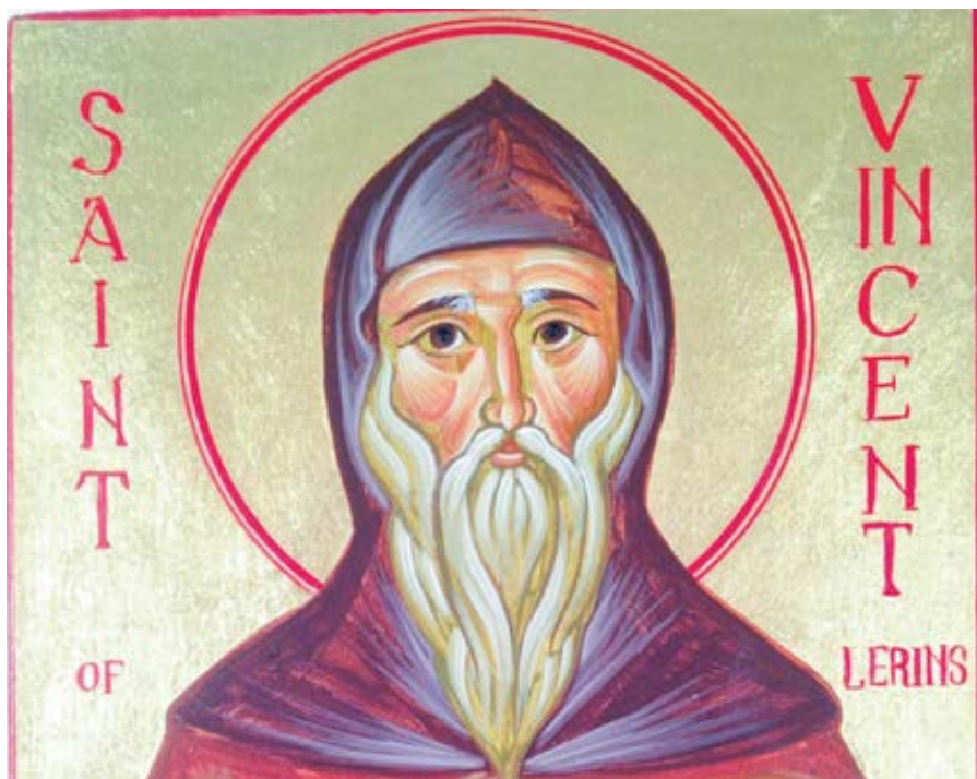
Brian Matthew Whirledge: Sv. Vincent Lerinský. Foto: iconsandchoes.com

Tento princip platí jako obecné kritérium pro posouzení možných změn nauky. Musí být rozvojem a nikoli odvoláním nauky staré. To samozřejmě platí pro nauku hlášanou neomylně. Připomeňme, že rozlišujeme a) neomylné slavnostní hlásání nauky, která je božsky zjevená v Písmu a/nebo posvátné tradici, b) neomylné hlásání nauky, která není Božím zjevením, ale logicky s ním souvisí, c) nikoli neomylné hlásání nauky.