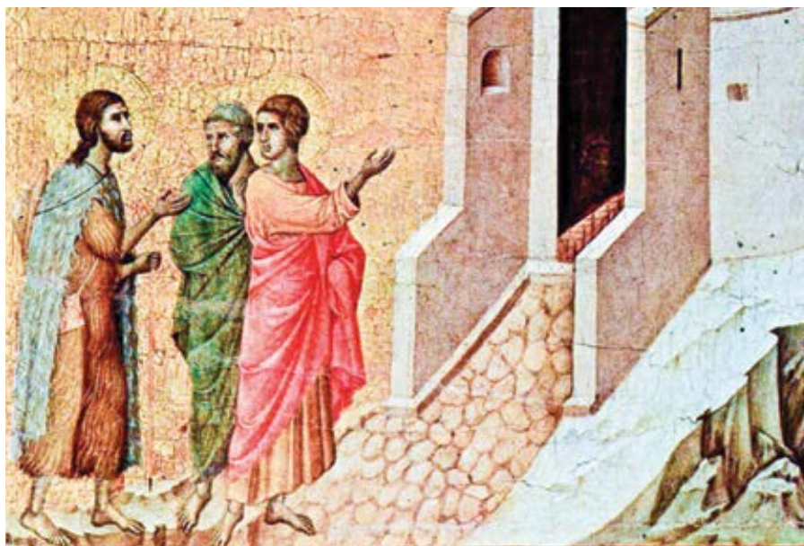
Duccio di Buoninsegna: Kristus se zjevuje dvěma učedníkům na cestě do Emauz (1308-1311)

Neboli slova andělova či Pánova je třeba chápat jako prorocství. Jde jim naproti do Galileje, jejíž název lze chápat také jako přechod, neboť se přechází od izraelského lidu k pohanům, kterým by apoštolové, kteří kázali, v žádném případě nesvěřili evangelium, kdyby jim sám Pán nepřipravil cestu do srdcí lidí. V tomto smyslu je třeba chápat i to, co se