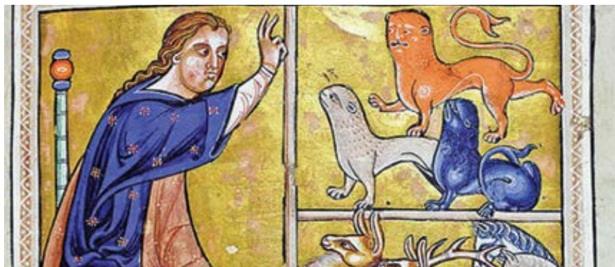
Aberdeenský bestiář: Adam pojmenovává zvířata. Manuskript z 12. st.

(Fakt č. 4: „Velmi dobré“ v knize Genesis znamená, že Bůh stvořil člověka pro nadpřirozený život, ale to, co je pouze „dobré“, stvořil Bůh jen pro přirozený život.)