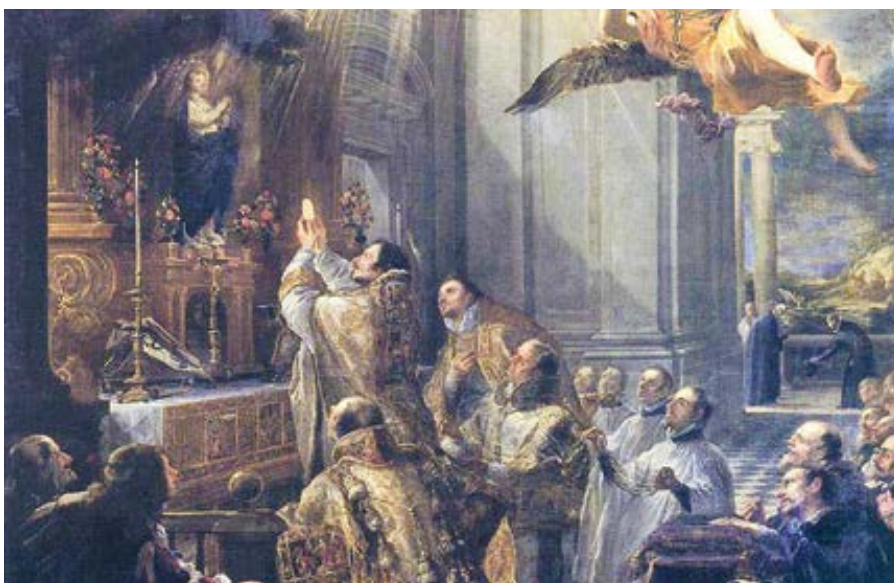
Juan Carreño de Miranda: Založení řádu trinitářů / Mše sv. Jana z Mathy (1666)

Otázkou tedy je, zda přijetí „pastoračního“ a neliturgického „žehnání“, které navrhuje Fiducia Supplicans pro páry žijící v neregulérních situacích, znamená