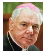
Gerhard Ludwig kardinál Müller kardinál jáhen, emeritní arcibiskup řezenský, bývalý prefekt Kongregace pro nauku víry