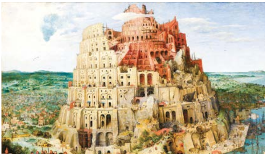
Pieter Bruegel: Babylonská věž (1563)

Strana hlásící se ke křesťanskému odkazu a mající ve svých stanovách pod-