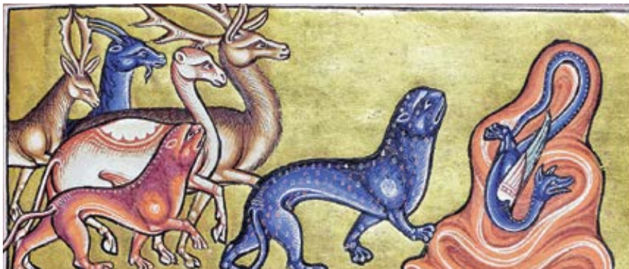
Aberdeenský bestiář. Manuscript z 12. st.

přijímat jeho milost, protože ho stvořil ke svému obrazu a podobě, člověk nemá moc stvořit zvíře se stejnou schopností, protože milost, která vede k věčnému životu, člověku nenáleží.