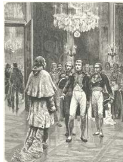
Charles Edouard Delort: Napoleon přijímá kardinála Ercole Consalviho v paláci Tuileries v Paříži (19. st.)

„Tváří i tvář problémům dnešního světa, kdy nám řešení unikají, kdy ne-