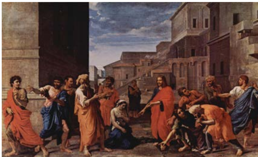
Nicolas Poussin: Kristus a žena přistižena při cizoložství (1653)

Proti námitkám nevědomých nebo heretických křesťanů, kteří tvrdí, že Ježíš nám řekl: „Nesudte!“, je nejlepší vysvětlit, že člověk má svou vnější složku a svou vnitřní složku, kterou nazýváme svědomí. Zatímco něčí svědomí nikdy nemůžeme soudit a nemůžeme být soudcem, který rozhodne, zda je jeho duše dostatečně dokonalá, aby se dostala do nebe, očekává se od nás, že budeme soudit něčí vnější složku, jak ji poznáváme na základě jeho skutků. Pokud by tomu tak nebylo, nikdy bychom se nesměli ozvat, když by muž znásilňoval ženu nebo kdyby osoba zneužívající děti vytvářela dětskou pornografii. Proti těmto činům se však samozřejmě ozýváme, stejně jako bychom se měli ozvat proti jiným skutkům, o nichž Bůh řekl, že jsou špatné, jako je například jakýkoli druh heterosexuálního pohlavního styku mimo manželství a jakýkoli druh homosexuálního pohlavního styku.