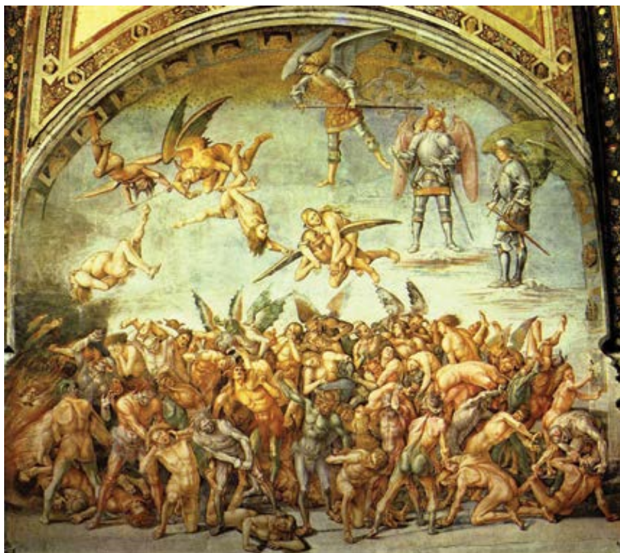
Luca Signorelli: Peklo. Freska v katedrále v Orviету 1499–1505)

Proto sám apoštol sv. Pavel, který usilovně zvěstoval, že Boží spása je k dis-