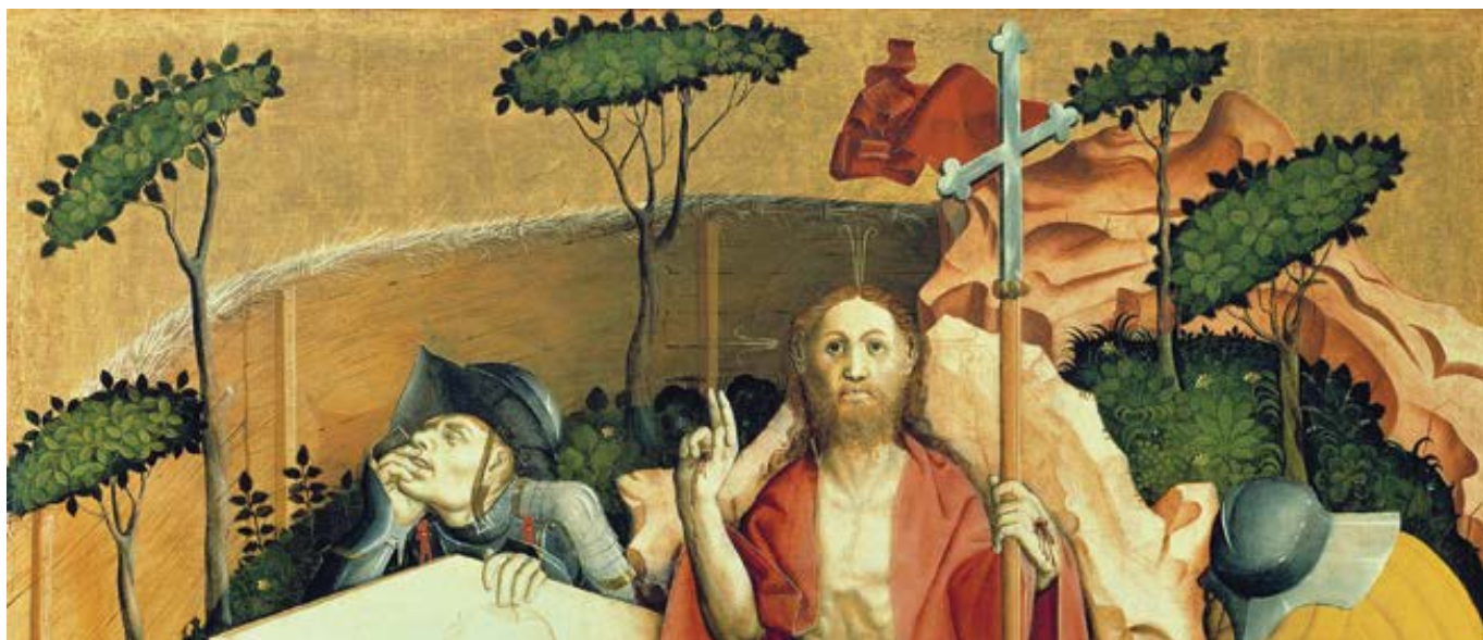
Hans Multscher: Zmrtvýchvstání Ježíše Krista (1437)