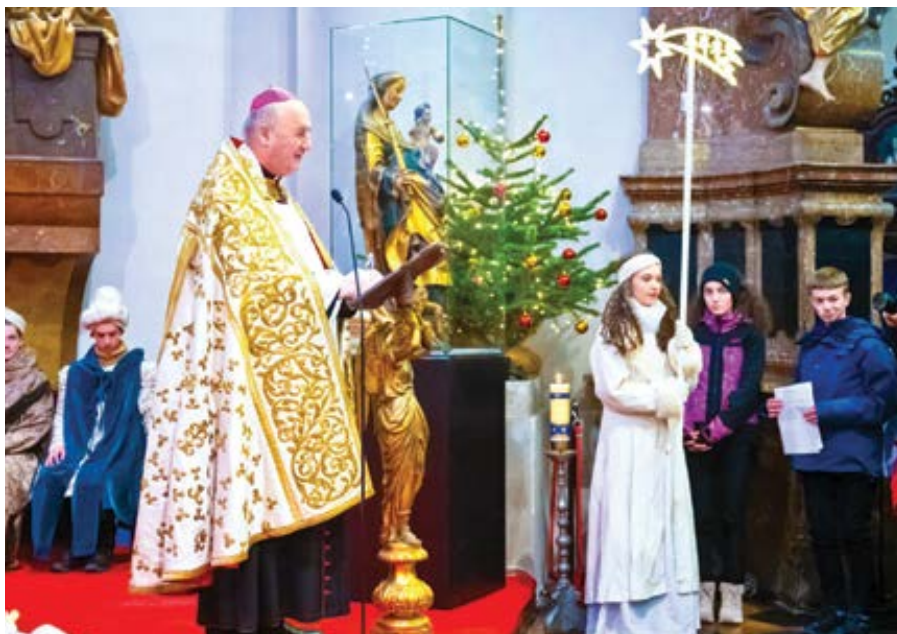
V pátek 3. ledna 2025 byla zahájena Tříkrálová sbírka Charity Praha určená lidem v nouzi a těžkých životních podmínkách. Pražský arcibiskup Mons. Jan Graubner v kostele sv. Tomáše na Malé Straně požehnal shromážděným koledníkům a vyslal je tím na jejich misi.

Tříkrálová sbírka je jedním z mnoha projektů. Na začátku byla otázka: Jak zapojit do podpory charitního díla i lidi nekostelné, když sloužíme všem potřebným bez rozdílu. Tento projekt se opravdu vydařil víc, než jsme si představovali. Důležité je mít své poslání rád. Pak se ukáže, že láska je vynalézavá a přináší radost.