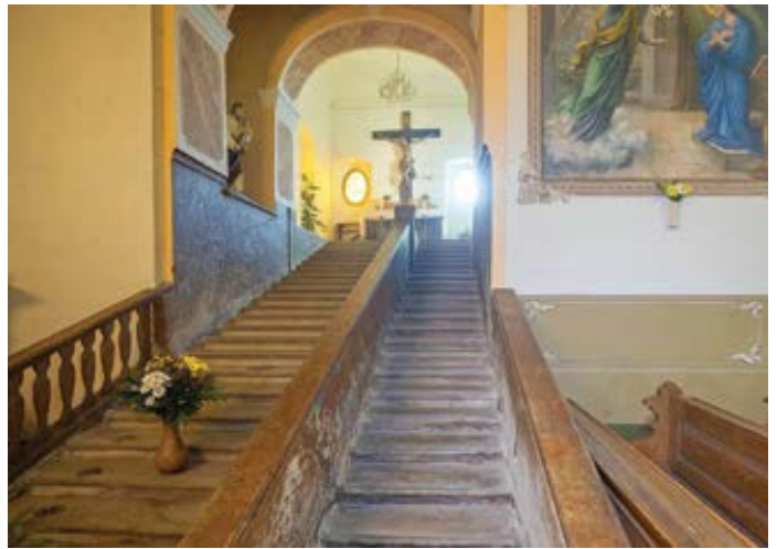
Kostel svatého Josefa v Krásné.