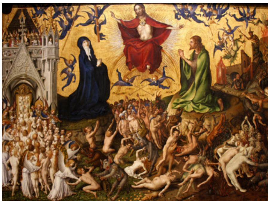
Stefan Lochner: Poslední soud (15. st.)

Hospodář je Kristus, který je sice pro své božství všude, ale říkáme, že už je uvnitř pro ty, kdo jsou blažení v nebi, protože na něj hledí, a jakoby venku pro ty, kterým pomáhá v zápasech na této pouti. Vstoupí s celou Církví, aby na něj moh-