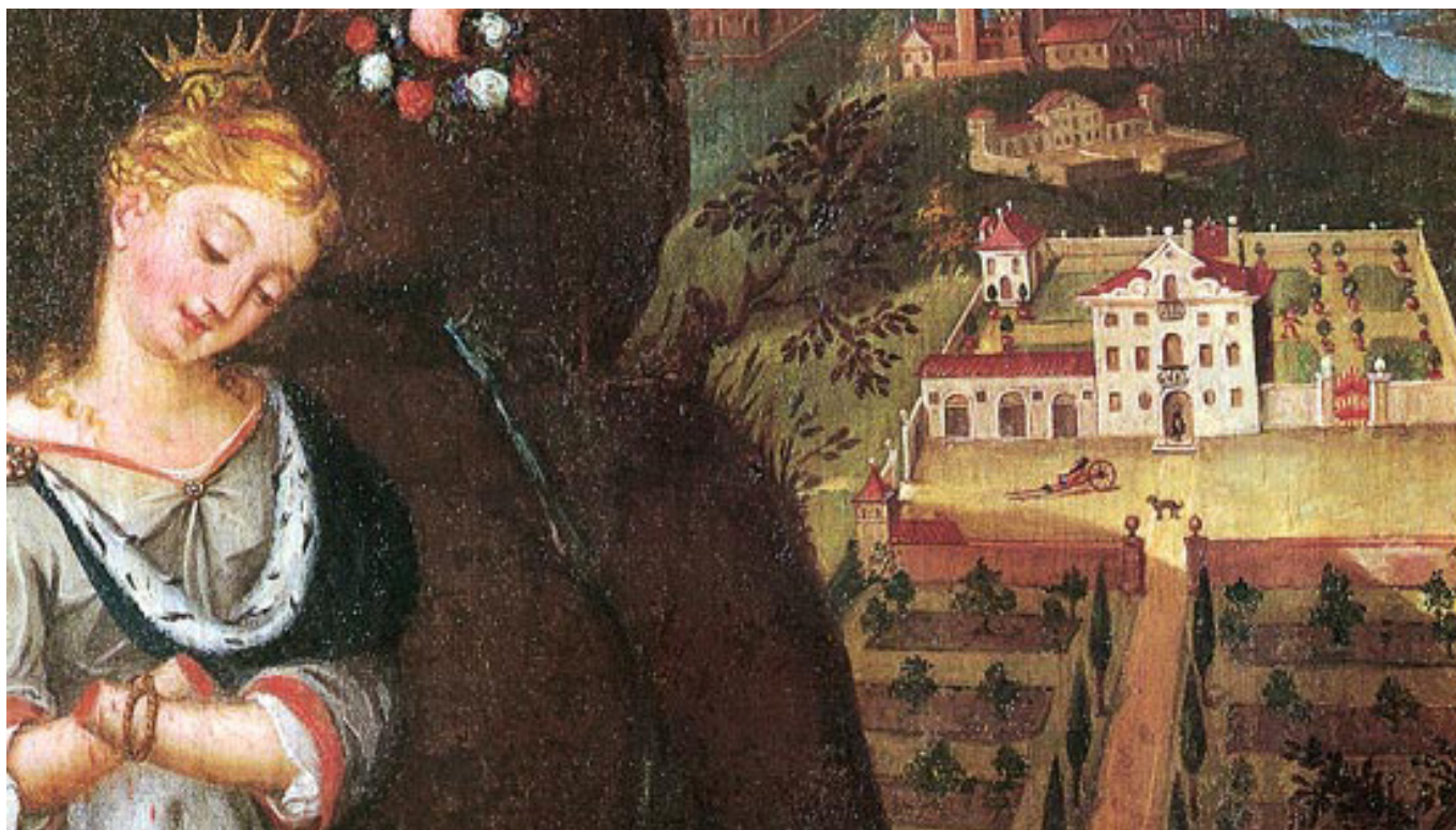
Obraz sv. Dobroslavy v Colle Umberto (17. st.)