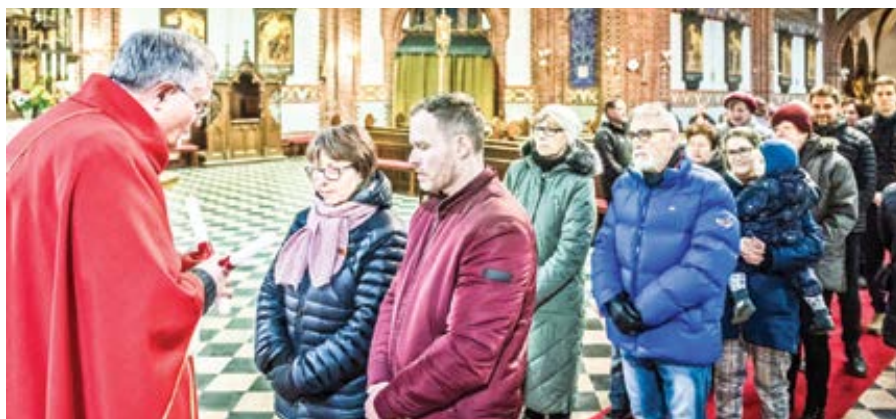
Svatoblažské požehnání.

Hlas právničky, která se mj. věnuje rodinným sporům a rozvodům: „Hlav-