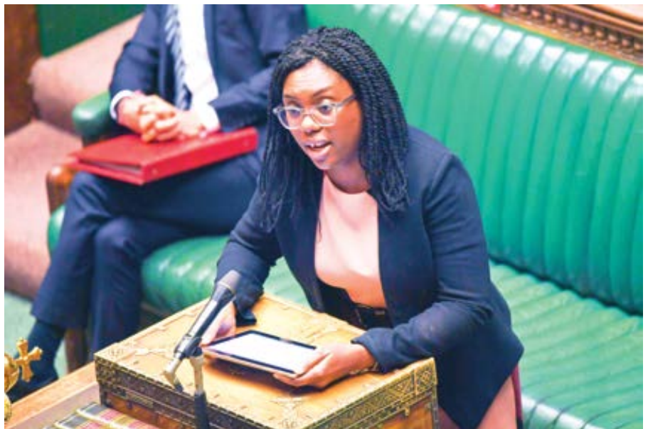
Britská konzervativní poslankyně Kemi Badenochová.

V parlamentu v době vyhrazené pro dotazování premiéra udělala vůdkyně toryů Kemi Badenochová (vůdkyně opozice a šéfka Konzervativní strany, je známá svými silně konzervativními postoji a kritikou tzv. „woke“ kultury – pozn. red.) z Keira Starmera (premiér Spojeného království a předseda labouristické strany – pozn. red.) naprostého hlupáka, který se zmožil jen na kličkování, když se snažil vyhnout odpovědnosti za tato zvěrstva. Pravdou však také je, že strana Badenochové, která byla u moci od roku 2011, kdy reportáže londýnských Timesů tento jev poprvé odhalily – a mnohá další odhalení budou ještě přibývat –, až do loňského podzimního vítězství labouristů neudělala pro řešení tohoto problému nic zásadního. Jde o krizi, která strahuje celý britský establishment, dokonce i krále Karla, který se znemožnil vánočním projevem, v němž chrlil obvyklé