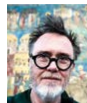
Rod Dreher spisovatel, novinář, blogger