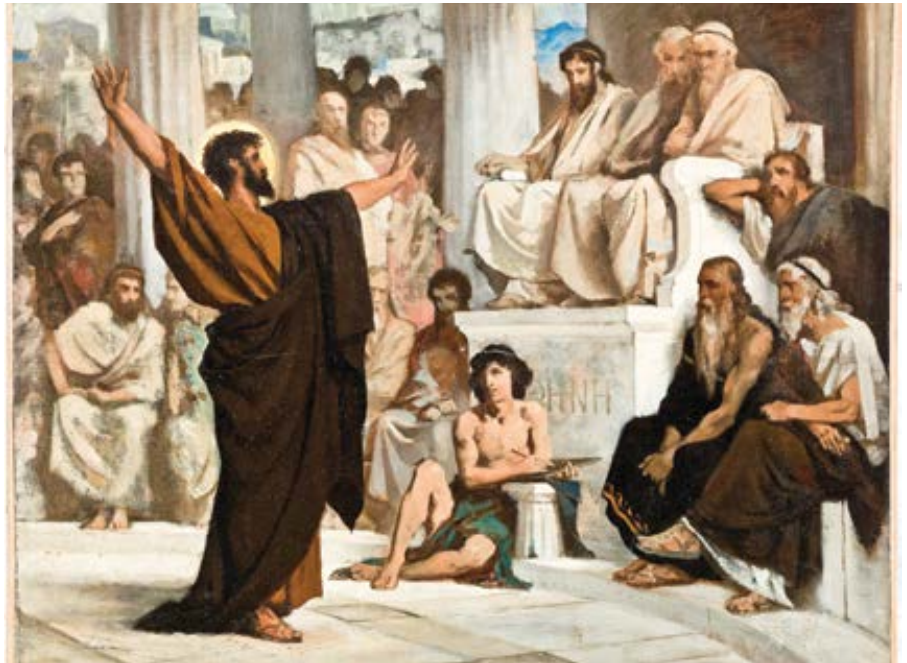
Edouard Bernard Debat-Ponsan: Sv. Pavel před Areopagem (1875)

Marcus Aurelius si ve svých Hovorách k sobě nejednou připomíná: Hned ráno k sobě promlouvej takto: Setkám se s člověkem všetečným, nevďečným, domýšlivým, potutelným, závistivým a sobeckým. Všechny tyto vady vyplývají z jejich neznalosti dobra a zla. Já však jsem dospěl k poznání, že dobro svou přirozeností je krásné a zlo je ošklivé a že také přirozenost právě toho, kdo chybuje, je příbuzná s mou, nikoli snad účastí na těže krve nebo rodu, nýbrž na téměř rozumu a jeho božském podílu: nemohu tedy od nikoho z nich utrpět škodu, neboť nikým