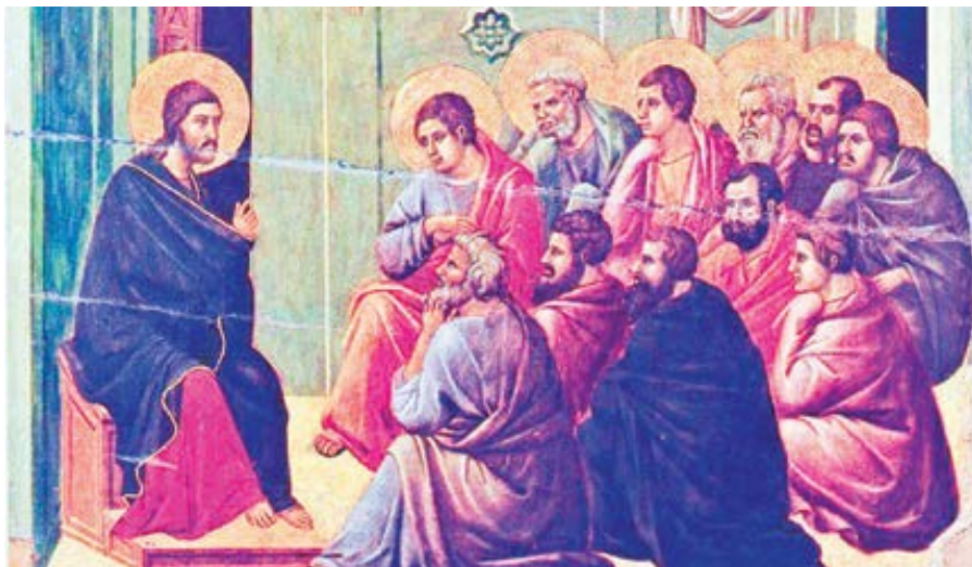
Duccio di Buoninsegna: Kristus se loučí s apoštoly (1308–1311)

Člověk se skládá z těla a duše. K duši se chováme dobře tehdy, když ji káráme, napomínáme a všemožně vedeme k obrácení; k tělu pak tehdy, když mu poskytujeme to, co je nezbytné pro život. Následuje: „žehnejte těm, kdo vás proklínají.“ Neboť ti, kdo si sami probodávají duši, si zaslouží slzy a pláč, ne proklínání. Vždyť není nic odpornějšího než duše, která zlořečí, a nic nečistšího než jazyk, který vyslovuje kletby. Jsi člověk: nevy pouštěj jed jako zmije a neměň