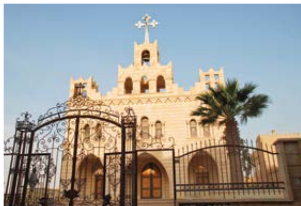
Ortodoxní kostel v Hasace v syrském Kurdistanu.

že v boji proti svým utlačovatelům za autonomii a nezávislost se Kurdové na oplátku snažili potlačovat jiná etnika, zejména Armény a Asyřany. Představa svobodné, pluralitní společnosti nepatří k povaze muslimů. Kurdové jsou navíc marxisté. Jinými slovy, kromě toho, že jsou muslimové, marxisté a rebelové, nejsou Kurdové dobrými sousedy.