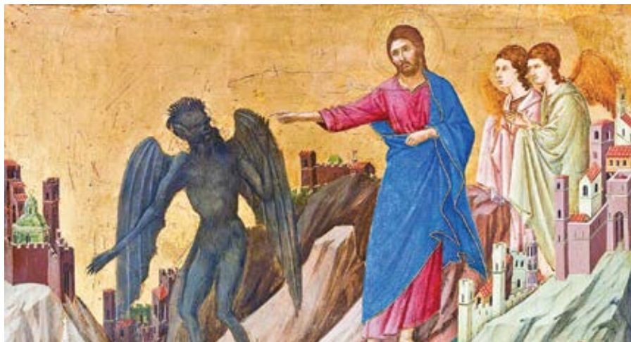
Duccio di Buoninsegna: Pokušení Krista na hoře (1308–1311)

Náš nepřítel však nedokázal pokoušením otřást myslí Prostředníka mezi Bohem a lidmi. Ten laskavě podstoupil pokušení zvnějšku tak, že jeho mysl, která přilnula k božství, zůstala uvnitř neotřesená.