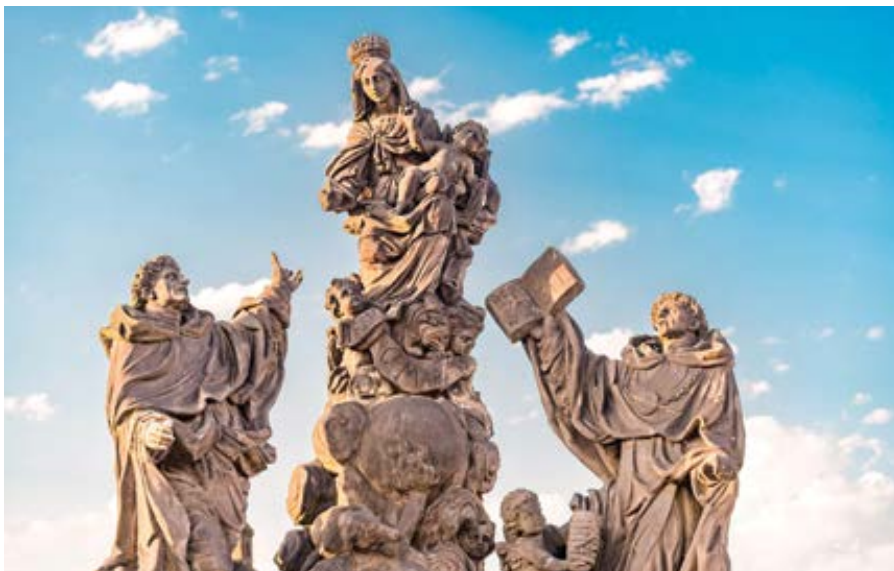
Sochy Madony, sv. Dominika a sv. Tomáše Akvinského na Karlově Mostě.

Pro hříšníka je realita balvanem, na který naráží, ostnem, o který se zraňuje. Důvodem je, že stvořený svět v posledku závisí