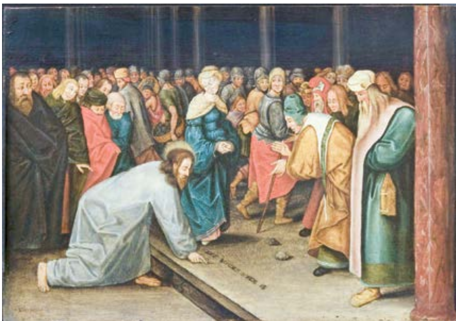
Pieter Bruegel mladší: Kristus a žena obviněná z cizoložství (cca 1600)

Již dříve si všimli jeho velké laskavosti. Jako učitel přinesl pravdu, jako osvoboditel laskavost a jako soudce spravedlnost. Lidé uznávali pravdivost jeho slov a jeho zdrženlivost vůči nepřátelům chválili jako laskavou. Proto mu nastražili past v oblasti spravedlnosti. Řekli si totiž: pokud ji propustí, nezachová spravedlnost, protože Zákon přece nemohl přikázat nic nespravedlivého. Proto se na Zákon odvolávají: „Mojžíš nám v Zákoně nařídil takové ženy ukamenovat. Co říkáš ty?“ Chtěli ho obvinít, a proto evangelista dodává: „Tou otázkou ho chtěli přivést do úzkých, aby ho měli z čeho obžalovat.“ Pán však svou odpovědí zachová spravedlnost, aniž by se odchýlil od laskavosti.