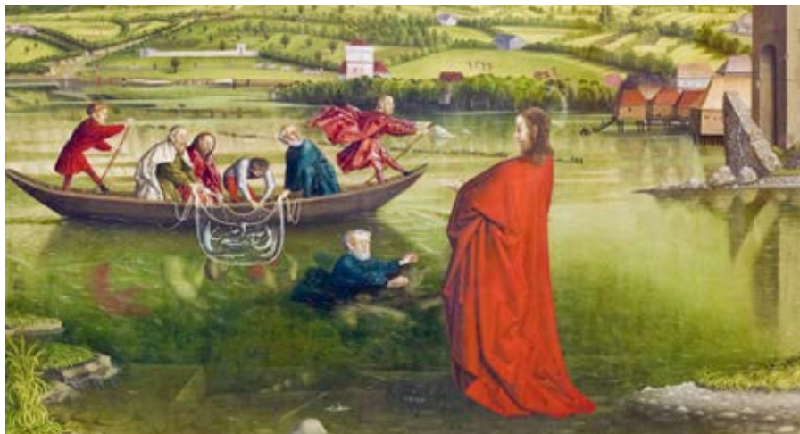
Konrad Witz. Zázračný rybolov (1444)

Když se ho pak potřetí zeptal, Petra to zarmoutilo; proto následuje: „Petra zarmoutilo, že se ho potřetí zeptal: Máš mě rád?“ Báł se, že opět dostane výtku, že si snad myslí, že miluje, ač nemiluje, jako když byl dříve pokárán za to, že si příliš