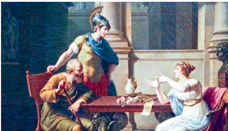
Nicolas-André Monsiau: Aspasia hovoří se Sókratem a Alkibiadem (1801)