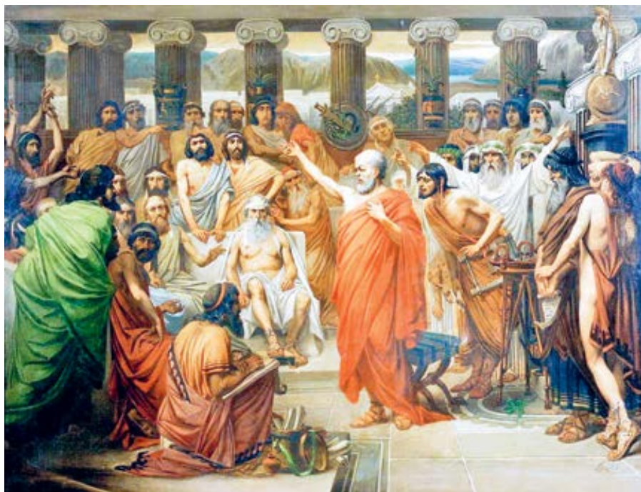
Louis Joseph Lebrun: Sokrates hovoří během soudu (1867)

své kultuře připravil půdu pro hledání moudrosti. Poté přechází k Sókratovým předchůdcům, jako byli Thalés, Hérakleitos a Pythagoras, kteří začali rozvíjet teorie o povaze reality (metafyziku). Možná k překvapení moderních čtenářů, kteří zastávají opačný názor, filozofie na počátku dějin nečekanými a vynalézavými způsoby spojovala spiritualitu, teologii, vědu, etiku, a dokonce i matematiku. Poté vstupuje na scénu titulní hrdina této knižní řady, Sókrates, a přetváří tento rozporuplný myšlenkový chaos v cosi uspořádaného a definovatelného. Spolu se svými dvěma následovníky Platónem a Aristotelem tvoří trojici, která určila směr filozofického myšlení v antickém a středověkém světě. Kreeft jim proto věnuje mnoho stran, zejména Platónovi a Aristotelovi, kteří své myšlenky skutečně zaznamenali (Sókrates ve Faidrovi potřebu psaní zavrhl).