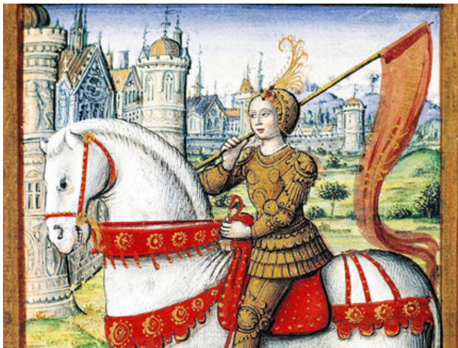
Jean Pichore: Jana z Arku (1506)

vyšel na bílý den. (...) Půjdeš za mnou všude, kamkoli tě povedu.“ Vypravěč, inspirovaný postavou Johančina pážete a tajemníka Louise de Contesa, k tomu říká, že Panna měla „úžasný dar roznitit srdce zoufalých mužů ušlechtilým nadšením, proměnit zajíce v hrdiny a z otroků a trucovitých mezků sestavit prapory, jež s písní na rtech pochodují na smrt“. Johanka se tak na vojáky dívá Božíma očima. Vidí, jak velikému úkolu je každý z nich povolán, vztahuje ruku a vyzývá je, aby povstali. Takováto malá Johanka z Arku by se v životě hodila každému z nás.