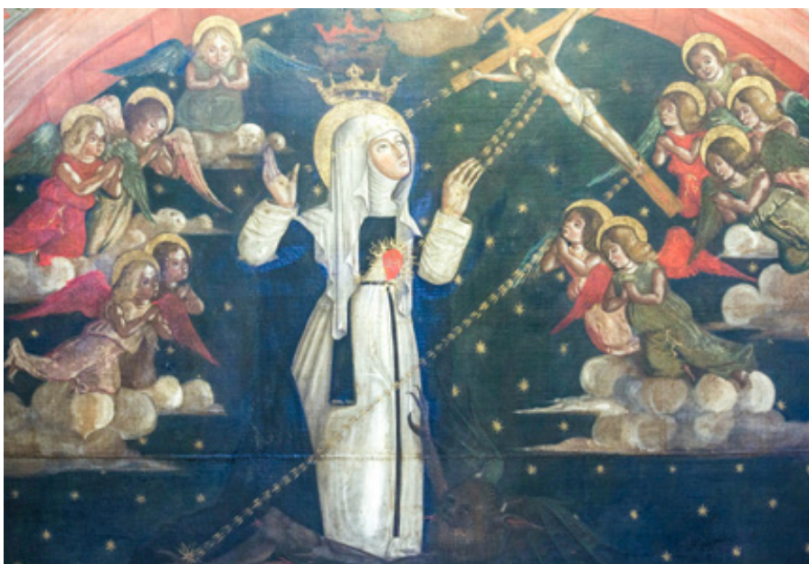
Triumf sv. Kateřiny Sienské

Lumen gentium realisticky přiznává, že církev „zahrnuje ve svém vlastním lůně hříšníky“. To znamená, že konkrétní podoba církve v dějinách je vždy poznamenána slabostí lidí. Proto církev potřebuje neustálé očišťování a ustavičně kráčející cestou pokání a obnovy (srov. LG 8). Není to tedy společenství dokonalých,