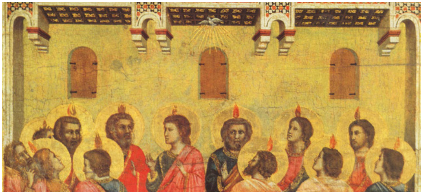
Giotto: Letnice (cca 1300)