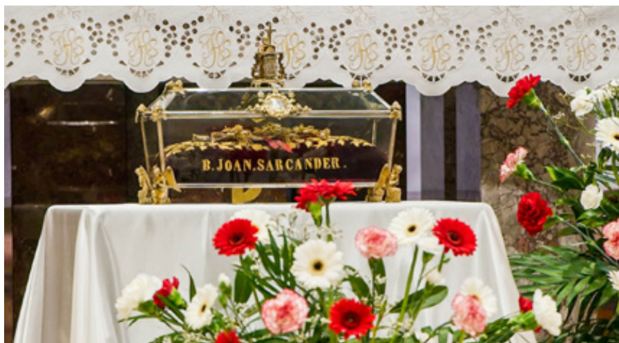
Ostatky sv. Jana Sarkandra, jehož horlivost byla spojena s důvěrou v Nejsvětější svátost oltářní.

A přeče se něco mění. Ve Spojených státech podle nových údajů poprvé po pětadvaceti letech vzrostla návštěvnost bohoslužeb. Ano, čtete správně: vzrostla. V době, kdy jsme si zvykli mluvit jen o úbytku věřících, zavírání kostelů