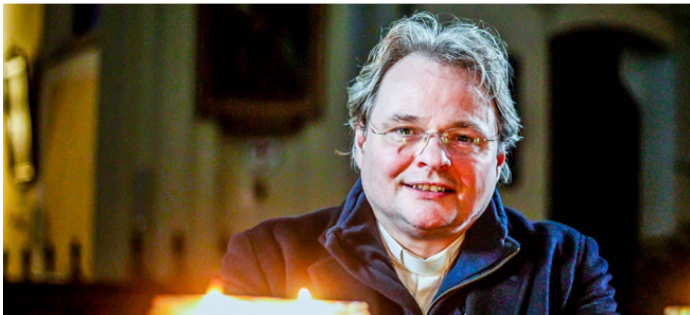
Giotto: Letnice (cca 1300)