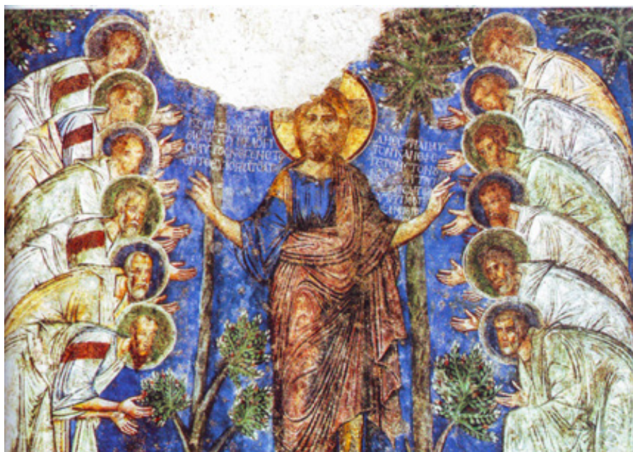
Sandro Botticelli: Nejsvětější Trojice (1491–1494)

Číslo dvanáct, složené z trojky a čtyřky, označuje ty, kteří měli jít hlásat víru ve svatou Trojici do čtyř světových stran. Toto číslo předznamenávají také mnohé obrazy ve Starém zákoně: dvanáct Jakubových synů, dvanáct soudců synů Izraele, dvanáct vodních pramenů v Elimu (Ex 15,27), dvanáct kamenů v Áronově náprsníku (srov. Ex 28,15–30), dvanáct předkladných chlebů, dvanáct zvěďů, kte-