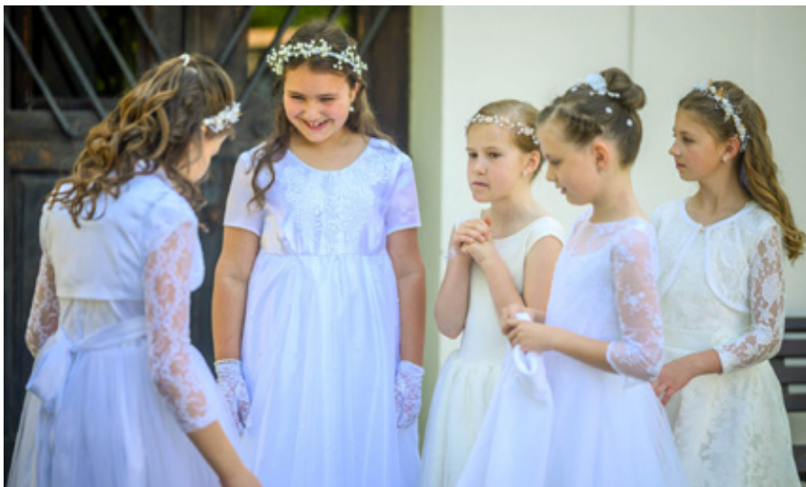
Z prvního svatého přijímání.

Transhumanistický sen tak začíná připomínat staré pokušení v novém obalu: „budete jako bohové“. Tentokrát ne skrze ovoce ze stromu, ale skrze čip, model, síť a slib, že tělo je jen zastaralý hardware. Katolická víra však trvá na tom, že člověk není omyl přírody čekající na aktualizaci. Je stvořen k Božímu obrazu, vykoupen Kristem a povolán k věčnosti. Mou pozornost speciálně upoutala skutečnost, že papež v encyklice cituje J. R. R. Tolkiena, resp. postavu Gandalfa z Pána Prstenů , jehož moudrost je neokázalá a říká: „Člověku nepřísluší řídit všechny proudy světa, ale má konat to, co je mu dáno v době, do níž byl postaven.“ Gandalf pronáší tato slova ve třetím svazku Pána prstenů , Návratu krále ,