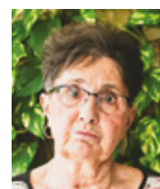
Věra Eliášková dramaturgyně a scénáristka