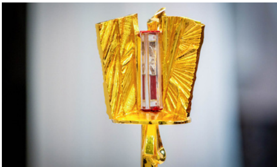
Relikviář s ostatky bl. Jana Buly a bl. Václava Drboly.

Za normálních okolností by podobná věta sotva byla mezinárodní zprávou. Je to přece běžné katolické učení. Dnes však může znít skoro jako odvážné vyznání. Ne proto, že by se změnil Kristus nebo podstata svátostí, ale protože jsme si zvykli pokládat každou hranici za tvrdost a každý požadavek za nedostatek vstřícnosti.