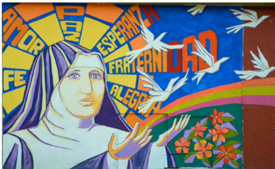
sv. Maria Francesca od Ježíše S.C.M.R.