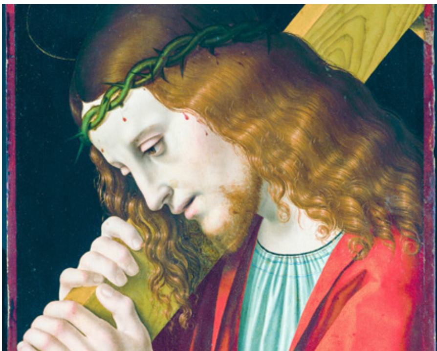
Marco d'Oggiono: Kristus nesoucí kříž (15. – 16. st.)

A aby to těžce nenesli ti, před nimiž se dává přednost lásce k Bohu, přivádí je k vyššímu učení. Nic totiž není člověku bližší než život, a přece přikázal nejen jej jednoduše nenávidět, ale vydat jej na smrt a zabití. Ukazuje tak, že je třeba být připraven nejen na smrt, ale na smrt násilnou a nejpotupnější, totiž na smrt na kříži; proto následuje: 38 Kdo nebere svůj kříž a nenásleduje mne, není mě hoden. Do té doby jim o vlastní smrti nic neřekl.