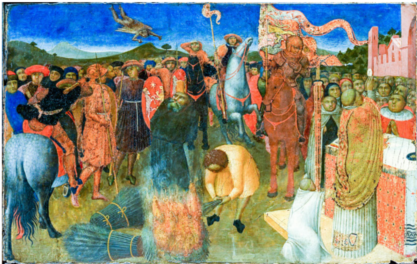
Stefano di Giovanni: Upálení heretika (1423–1426)