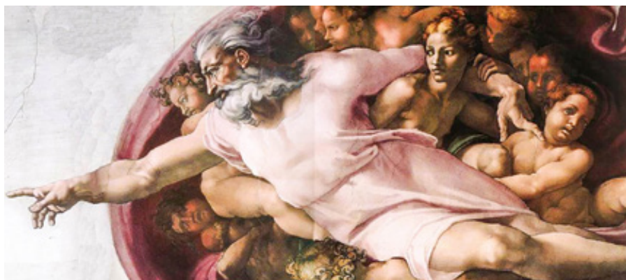
Michelangelo: Stvoření Adama (1510)

První cestou je rozum – ne jako chladný výpočet, ale jako schopnost ptát se po smyslu věcí. Už Tomáš Akvinský si všiml něčeho velmi prostého: nic z toho, co existuje, není samo ze sebe. Všechno vzniká, proměňuje se a zaniká. Svět není uzavřený – ukazuje za sebe. Pohyb světa odkazuje k prvnímu hybateli, řetěz příčin k první příčině, pomíjivost věcí k bytí, které nepomíjí. Stupně dokonalosti směřují k dokonalosti absolutní a řád, který ve světě pozorujeme, ukazuje na rozum, jenž tento řád nese. Nejde o to „vidět Boha“, ale pochopit, že svět bez Něho nedává plný smysl. Viditelné se tak stává stopou neviditelného. Rozum zde nepracuje proti víře, ale otevírá jí prostor: v tom, co je konečné a proměnlivé, rozpoznává potřebu základu, který sám proměnlivý není a na ničem dalším nezávisí. Rozum však zároveň naráží na své hranice. Může ukázat směr, ale nedokáže vstoupit do vztahu. Proto křesťanství říká něco zásadního: Bůh se dává poznat sám. V dějinách Izraele, skrze proroky a nakonec plně v osobě Ježíše Krista. Jak připomíná list Židům, Bůh mnohokrát mluvil – a nakonec promluvil v Synu. Zde se poznání proměňuje: už nejde jen o úvahu, ale o setkání. Neviditelný vstupuje do viditelného. A přesto ani tehdy nebyl samozřejmý – mnozí Ho viděli, a přece nepoznali. Poznání Boha totiž není jen otázkou smyslů, ale odpovědí člověka. Požadavek, aby byl Bůh viditelný jako předmět, tak není důkazem jeho neexistence, ale spíše nepochopením toho,