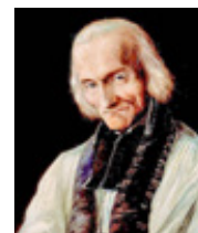
sv. Jan Maria Vianney patron kněží v duchovní správě