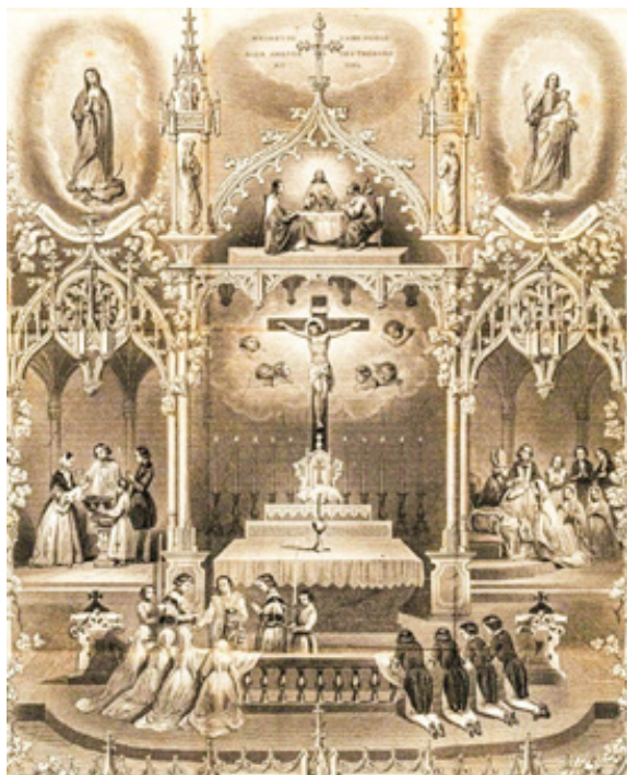
Francouzský novogotický náboženský tisk s motivem sedmi svátostí z konce 19. st.

rodinu – je to spíž. Církev je domovem duší; je to dům, který patří nám, křesťanům. Nuže, v tomto domě je také spíž. Vidíte svatostánek? Kdybyste se zeptali duší křesťanů: „Co je to?“, vaše duše by odpověděla: „To je spíž.“