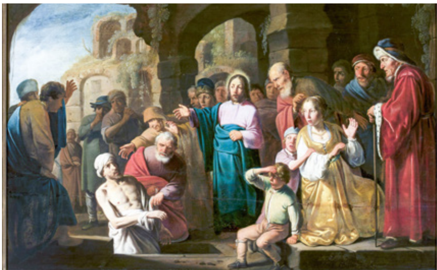
Claes Corneliszoon Moeyaert: Vzkříšení Lazara (1654)

Byly to dvě míle. A uvádí to proto, aby doložil, že nebylo nepravděpodobné, že tam bylo mnoho židů z Jeruzaléma; proto se dodává: „K Martě a Marii přišlo mnoho židů, aby je potěšili (v žalu) nad bratrem.“ Jak je však možné, že židé těšili ty, které měl Kristus rád, když už bylo rozhodnuto, že kdo ho vyzná, bude vyloučen ze synagogy (srov. Jan 9,22)? Těši-