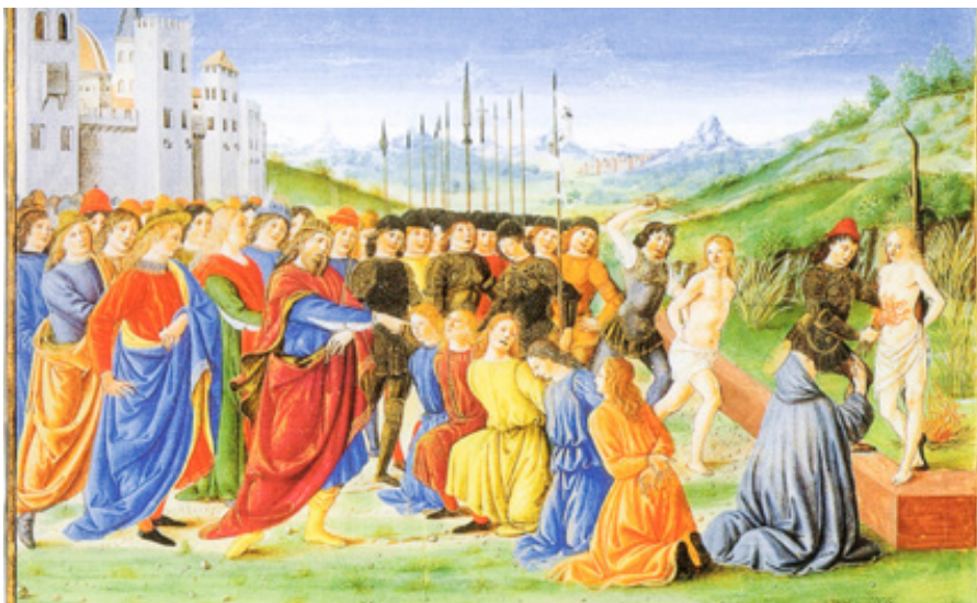
Attavante: Mučednictví sedmi židovských bratrů (1450–1470)

Velekněz Kaifáš ztělesňuje praktickou stranu. Držel se náboženských principů – alespoň na pergamentu – a použil je k obvinění Ježíše. Pak ale své náboženské zá-