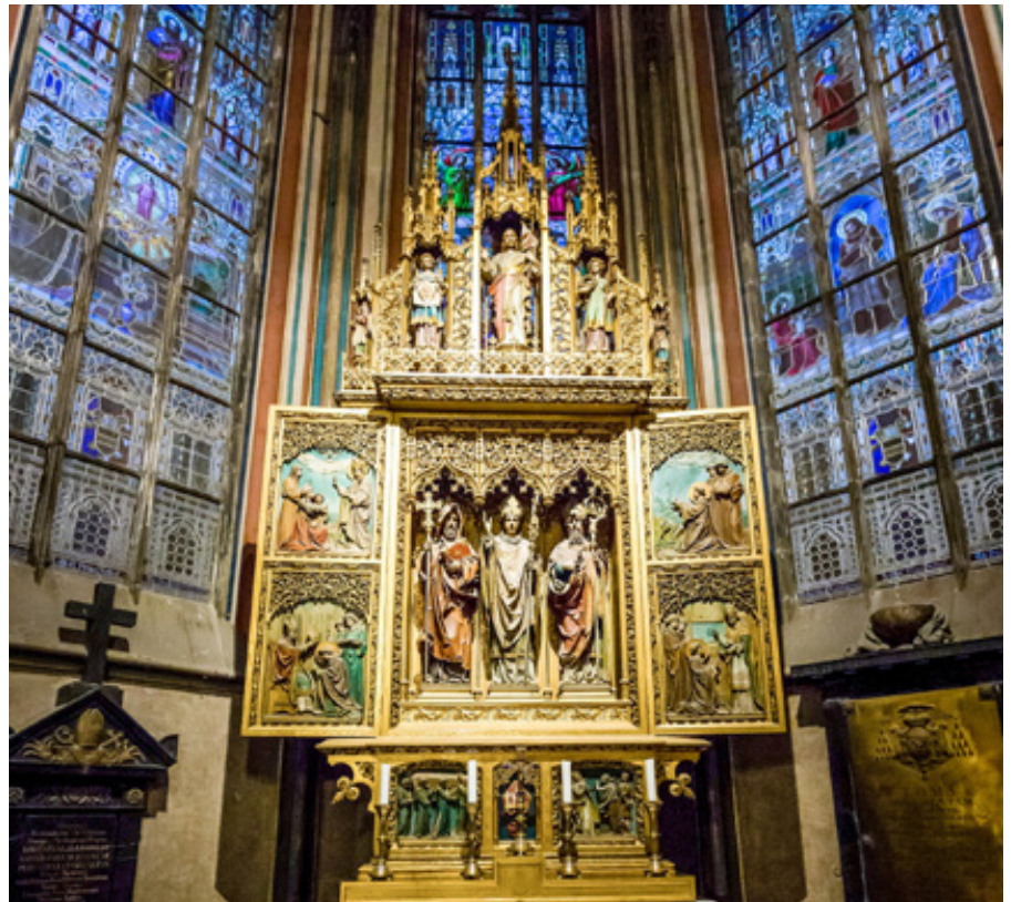
Kaple sv. Vojtěch v pražské katedrále.

Děj vzniku jednotných feudálních států z původních rodových držav šel svou silou i v Čechách a šel ke svému vyvrcholení. Ty se konstituovaly postupným zanikáním drobnějších útvarů a z hlediska státně národnostního již dosáhly moderně řečeno mezinárodně jasné identifikace. Prakticky zůstali již jen dva možní kandidáti na úplnou moc. Je dosti zajímavé, že k vojenskému řešení nebylo sáhuto rovnou. Volba sv. Vojtěcha za biskupa byla snahou řešit situaci kompromisem. Vedle přemyslovského