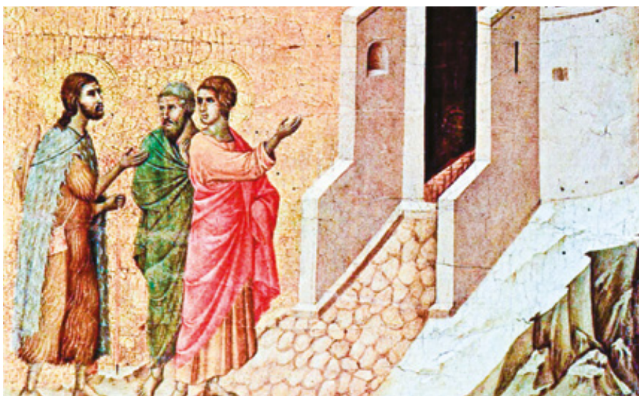
Duccio di Buoninsegna: Cesta do Emauz (1308–1311)

Když už měl oslavené duchovní tělo, vzdálenost místa mu nebránila být s těmi, s nimiž chtěl. Ani v jiných ohledech se jeho tělo neřídilo zákony přírody, nýbrž působilo duchovně a nadpřirozeně. Proto se jim zjevil v jiné podobě, v níž ho nemohli poznat: „Ale jako by jim cosi zadržovalo oči, takže ho nepoznali.“ Bylo to proto, aby vyjevili celou svou pochybnost: odkryli ránu a přijali lék. Také aby poznali,