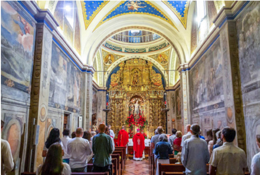
Česká mše svatá v kapli sv. Orosie v Jace.

několika sochařských děl připomínajících dobu Velké Moravy. Mimo jiné je tam také socha svaté Dobroslavy i s kamenem dovezeným přímo z hory Oturia.