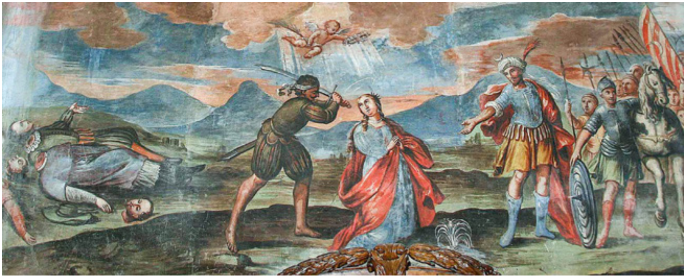
Nástěnná malba z kaple sv. Orosie v katedrále v Jace.