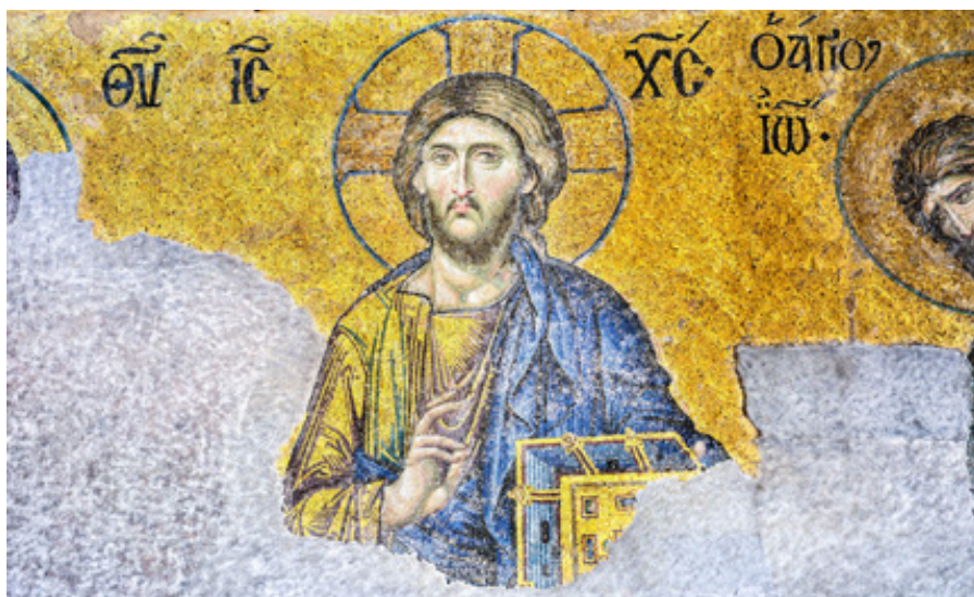
Deisis mozaika v istanbulské Hagia Sofia (cca 1261)

Když se Židé ptali Krista, kam jde, a přitom ho nechtěli mít mezi sebou, o to více to toužili vědět učedníci, kteří se od něho nikdy nechtěli odloučit. Z velké lásky