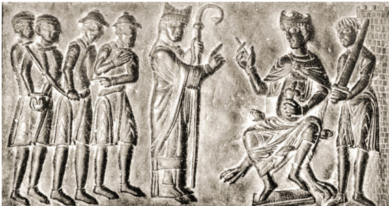
Detail z vrat v katedrále v polském Hnězdně: Sv. Vojtěch žádá knížete Boleslava II., aby nebyli do otroctví prodáváni křesťanští zajatci.